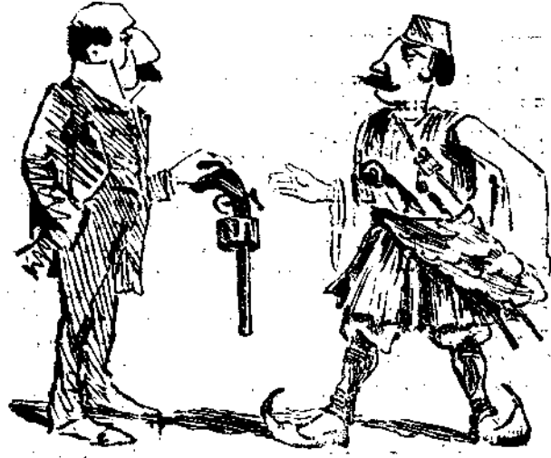
Η τίν ή επί τίν.