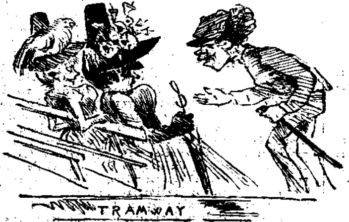
Να πάτε στα κλειστά.