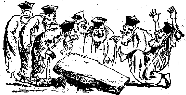
Η άναγκώρσις του εν Κανά της Παλαιάς Βίβου υπό της Ιεράς Συνόδου.