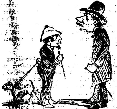
Δύο άπάρρητοι Νουμάριαι έάν ένυβέρνε ο Καρλιας.