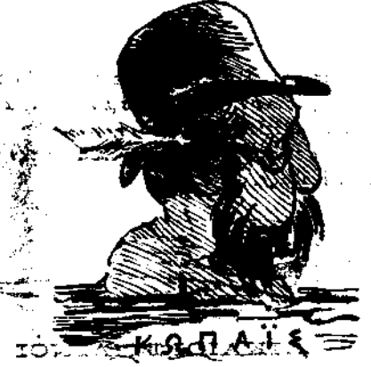
Ο Μινώταυρος άνακτων ένάμεις.