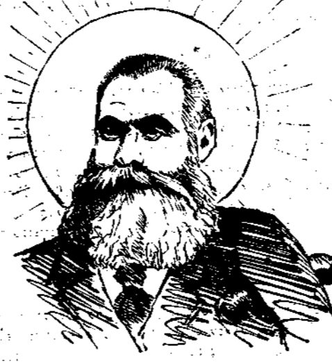
Ὁ ἐφευρέτης τοῦ τρισυνθέτου