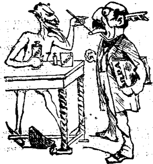
Μέτρα προφυλακτικὰ κατὰ τῆς λύσεως

«Τίς πταίει τέλος πάντων ἐὰν ὁ κ. Τρικούπης ἔπεσε πρὶν ἢ συμπληρώσῃ ἐντελῶς τὸ ἔργον τῆς ναταστροφῆς;» Τὴν φορὰν ταύτην ἔπτασεν ὁ Τρικούπης ὁ διαλύσας τὴν βουλήν.