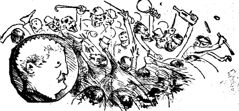
Ἐπὶ τῇ εἰκοσαετηρίδι τοῦ Συλλόγου Παρνασσοῦ