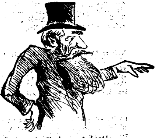
La Cigale ayant chanté Tout l'été.....