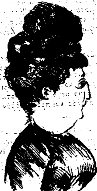
Η πρώτη όψιφανας