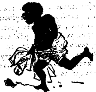
Διά νά προφθάσῃ τὸ τραίνον