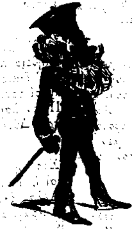
Παιπός και κλητήρ εις Τρικούπη