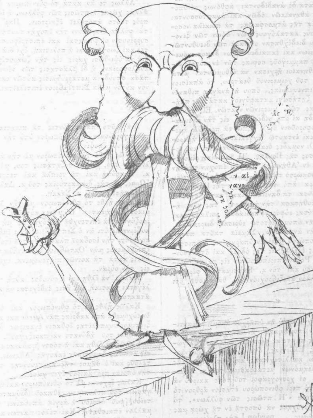
ΤΟ ΑΔΗΘΙΝΟΝ ΦΑΝΤΑΣΜΑ