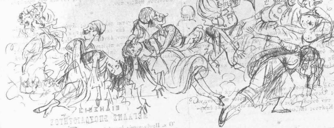
ΕΙΣΚΗΝΗ ΤΟΤΗΤΟΓΙΑΛΟΥΣ ΚΗΑΑΤ