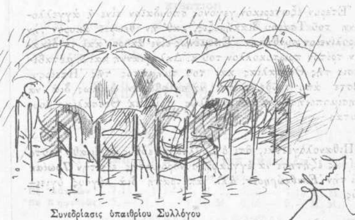
Συνεδρίασις ὑπαιθρίου Συλλόγου