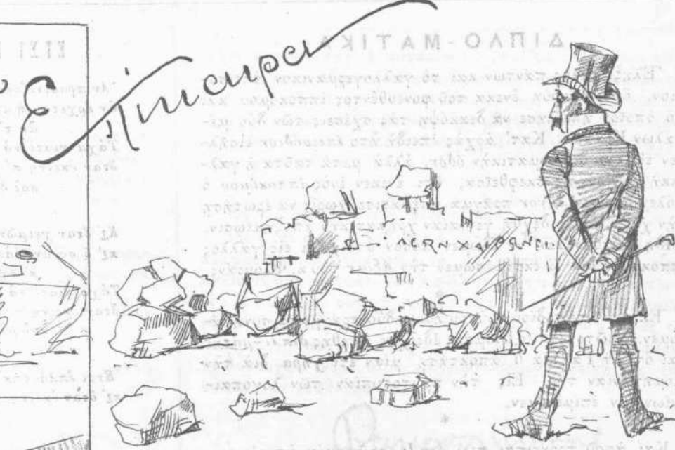
Ἐστῆθη ἐπὶ τῇ ἀπολείᾳ τῆς Ἑλλάδος καὶ ἀνοροῦνται ἀπὸ τῇ ἀναβίωσιν αὐτῆς.