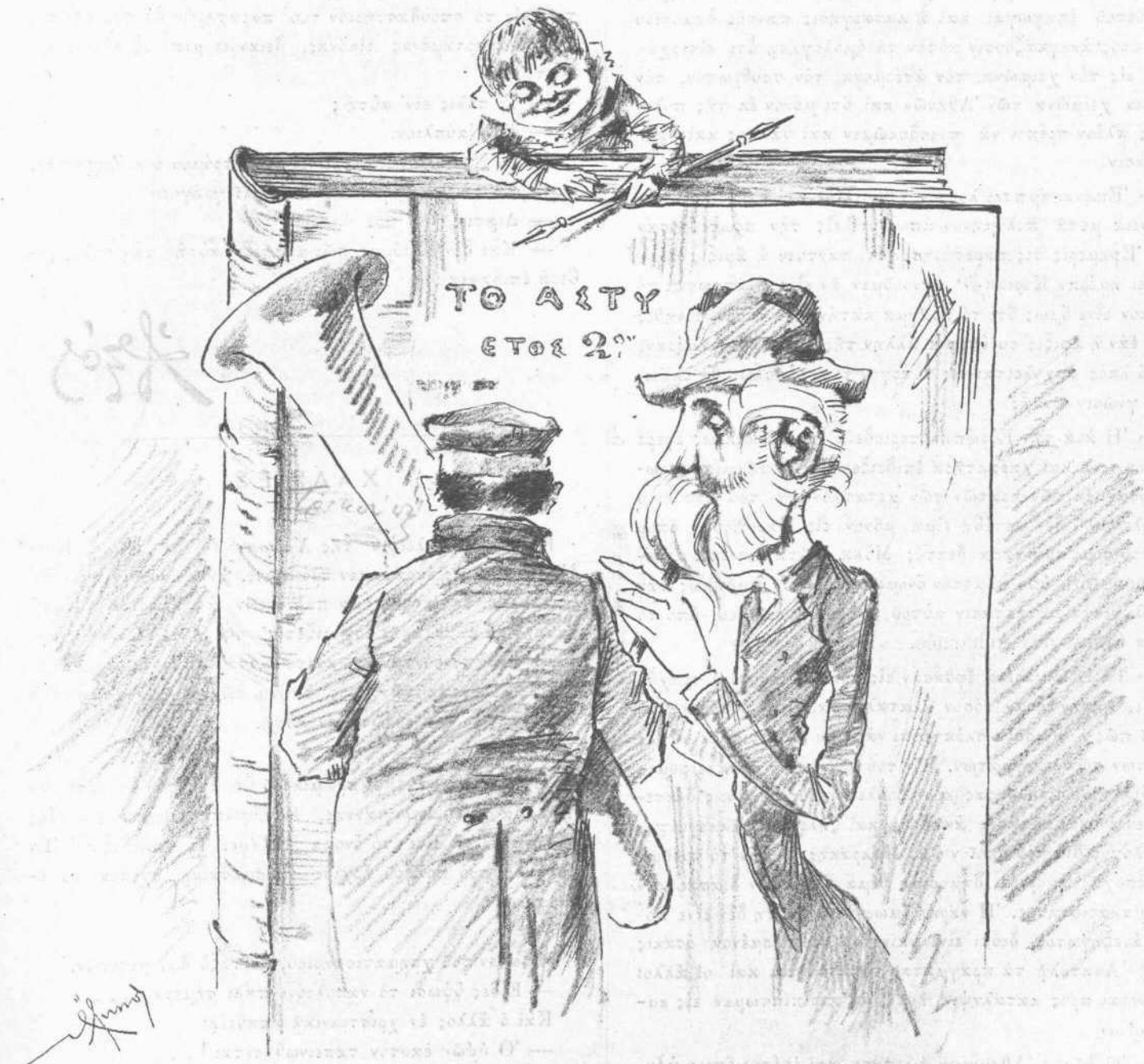
Ἐπὶ τοῖς γεννεθλοῖς τοῦ «Ἀστέος»