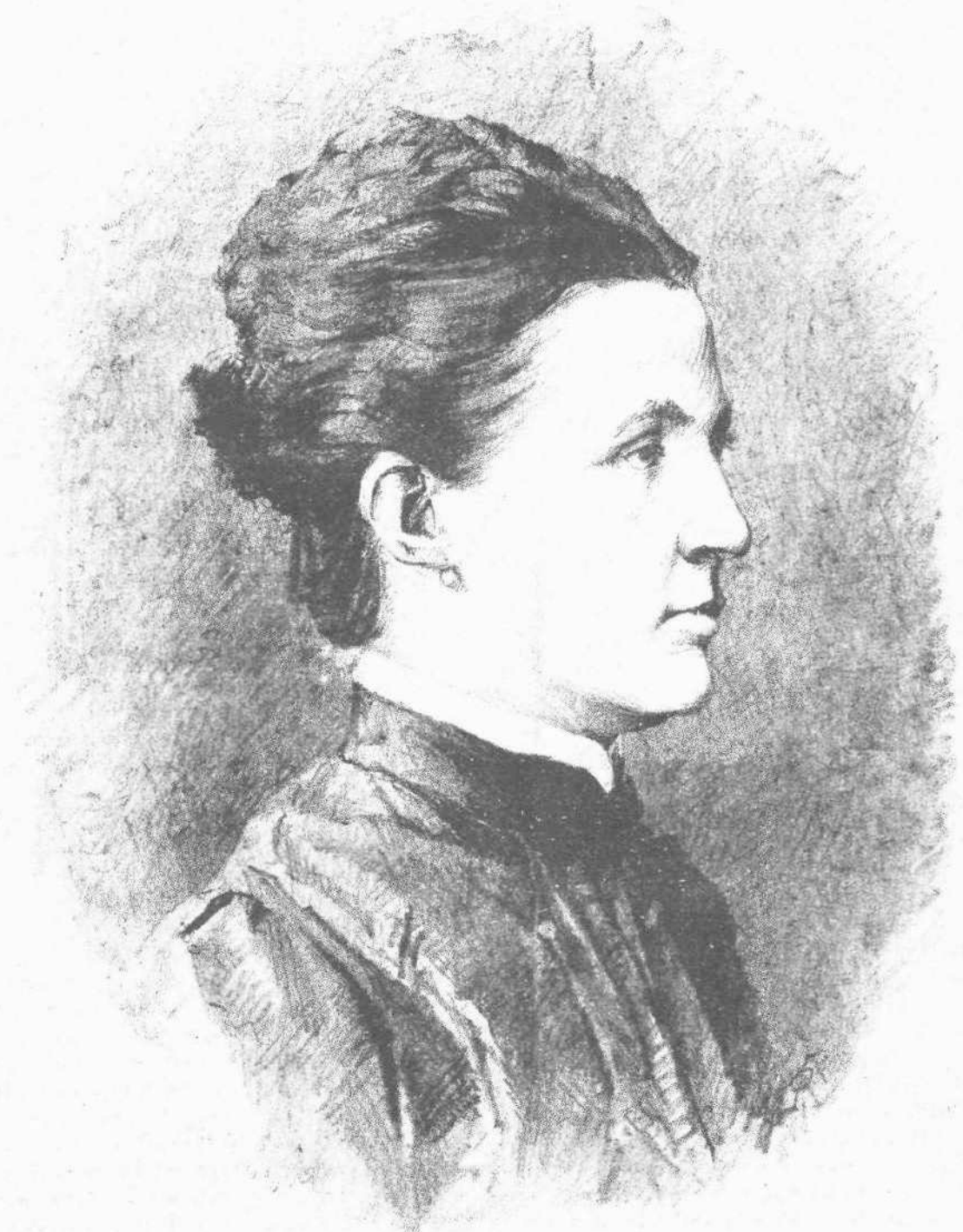
Ἡ ΠΡΙΓΚΙΠΙΣΣΑ ΘΗΡΕΣΙΑ