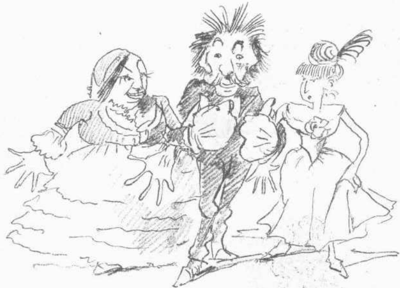
ΔΗΜΑΡΧΟΙ ΕΝ ΣΤΟΛΗ: