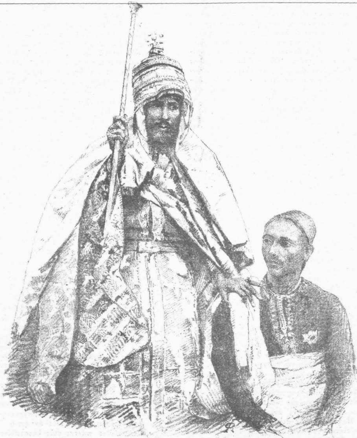
Ο ΑΥΤΟΚΡΑΤΩΡ ΤΗΣ ΑΒΥΣΣΙΝΙΑΣ ΙΩΑΝΝΗΣ ΚΑΙ Ο ΔΙΑΔΟΧΟΣ