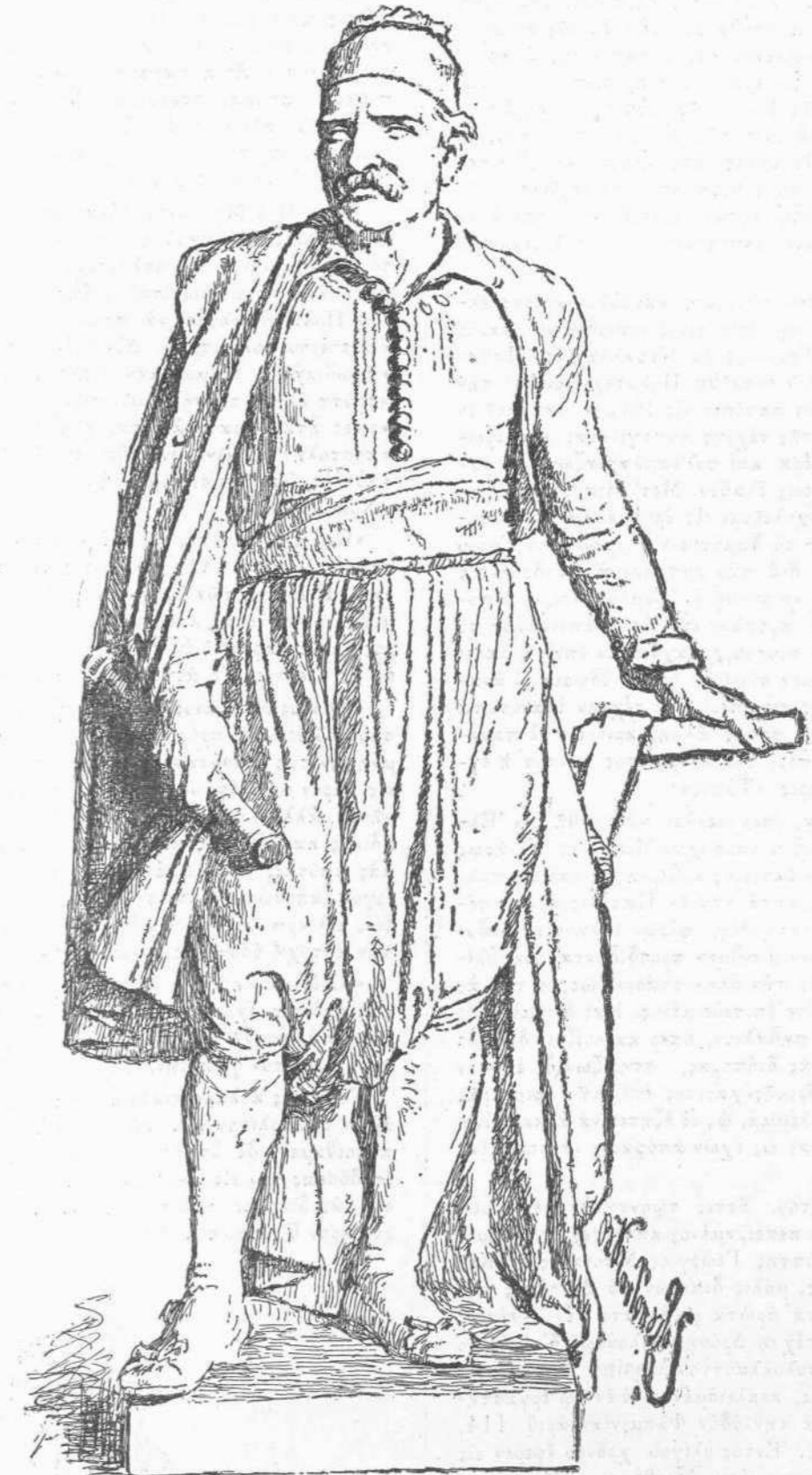
ΑΝΑΡΙΑΣ ΝΑΥΑΡΧΟΥ ΜΙΑΟΓΑΝ