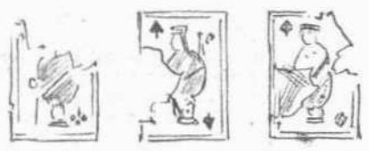
Τὰ μόνα θύματα