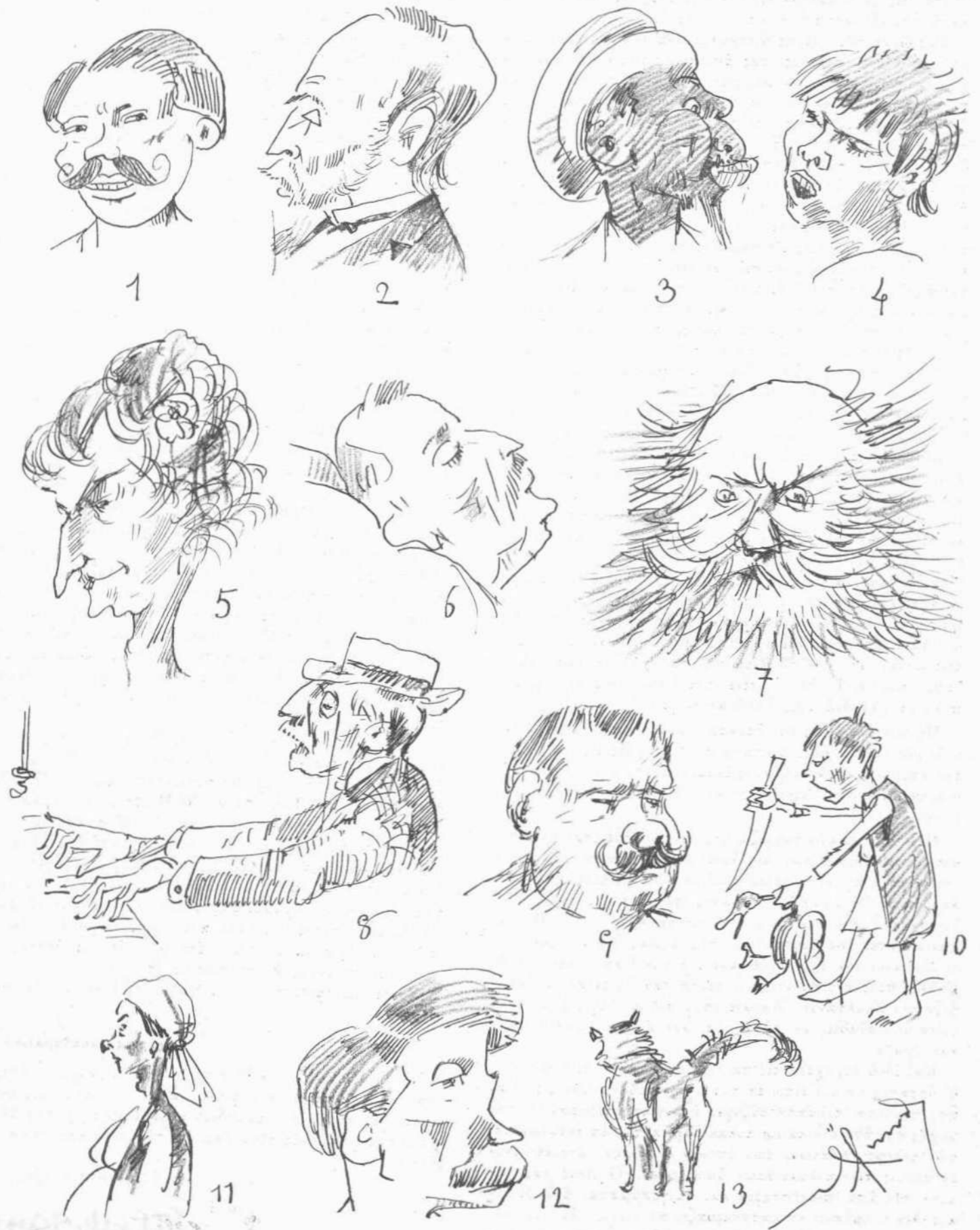
Ἐκ τῶν εἰκονογραφημένων ἡμερησίων. 1. Ὁ Κριτανέλης. — 2. Ὁ Βαριαδάκης. — 3. Ὁ διευθυντὴς τοῦ Αἰγυπτιακοῦ Θιάσου. — 4. Ὁ Κίν. χαρῆς. — 5. Ἡ πρώτη ὑψίφωνος. — 6. Ἡ κεφαλὴ τοῦ Ἀρτόζη. — 7. Ὁ Φούντας. — 8. Ὁ Μπετίνης, ἔξοχος κυμαλῆς. — 9. Ἐξοχότης Πειραιᾶ. — 10. Ὁ Γαλατᾶς 7 ἐτῶν. — 11. Ἡ θεὸς τοῦ Κάχαρη. — 12. Τῶ ἔδδθη χάρις. — 13. Ἡ γάτα τοῦ Γαλατᾶ.