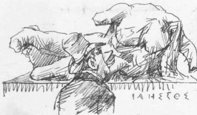
Πῶς ὁ Εἰνός θά τόν κάμη πλωτόν ;