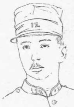
Ο ΥΠΟΔΟΧΑΓΟΣ ΒΑΓΚΕΝ

‘Ο πληγείς παρή τὰ Γαλλογερμανικά σύνορα.