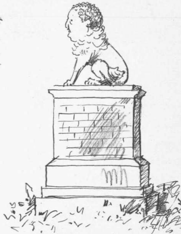
Ο λέων της Χαϊρονείας