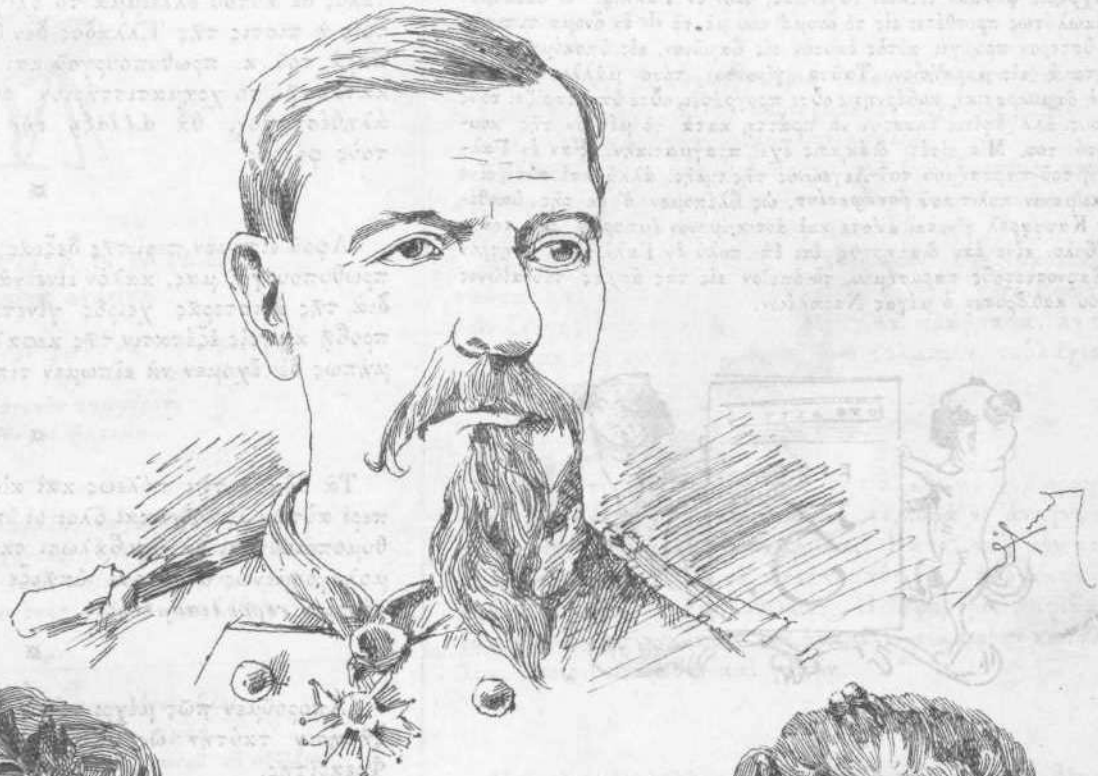
Ο ΣΤΡΑΤΗΓΟΣ ΚΑΦΦΑΡΕΛ