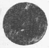
Τὸ φοιτητικὸν σημεῖον εἰς ὃ εὐρίσκειται ἡ ὑπόθεσις τοῦ νομισματικοῦ μουσείου