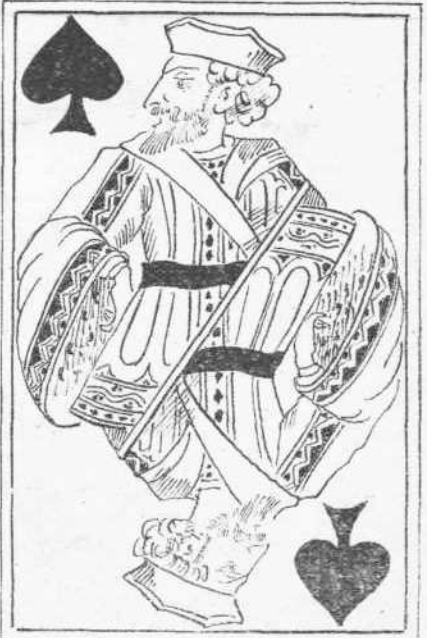
Φασουλῆς καὶ Περικλέτος ὁ καθένας Φάντες σκέτος