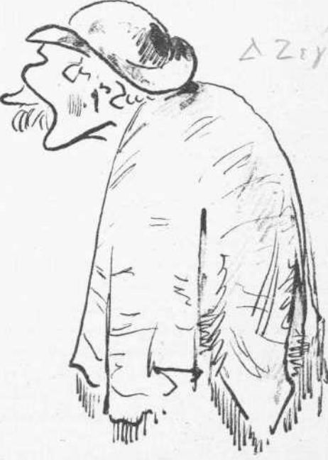
Ὁ Ἀπομείνας καλλικάντζαρος ὁ καταπιέζων τὸ πειστήριον τῆς Ἀκροπόλεως.