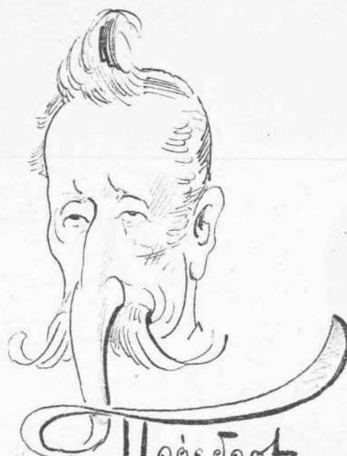
Ὁ Πρόεδρος τοῦ Κοινοβουλίου διὰ τὰς ἑορτὰς τοῦ φηωπιόχου