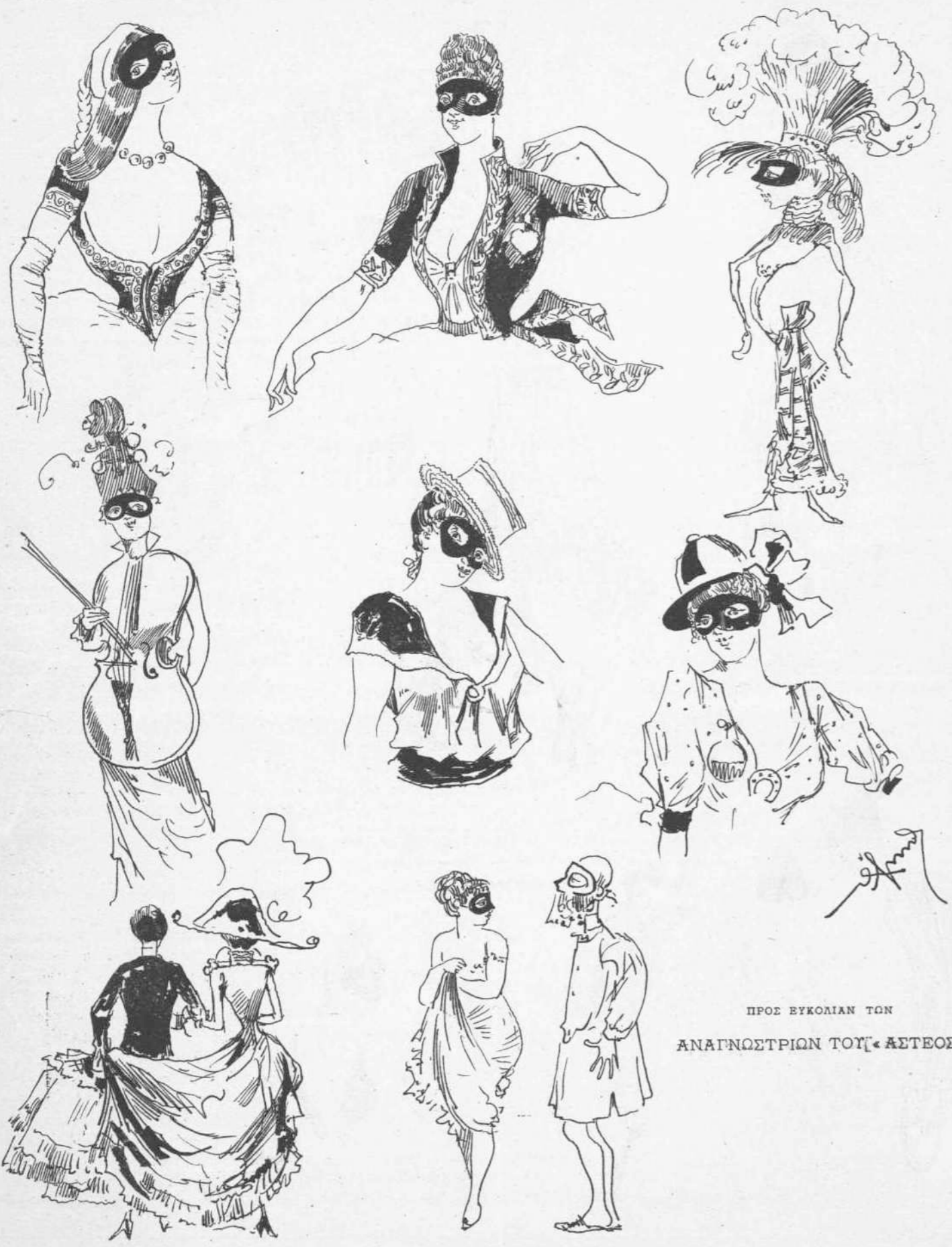
ΠΡΟΣ ΕΥΚΟΛΙΑΝ ΤΟΝ ΑΝΑΓΝΩΣΤΡΙΩΝ ΤΟΥ «ΑΣΤΕΟΣ»