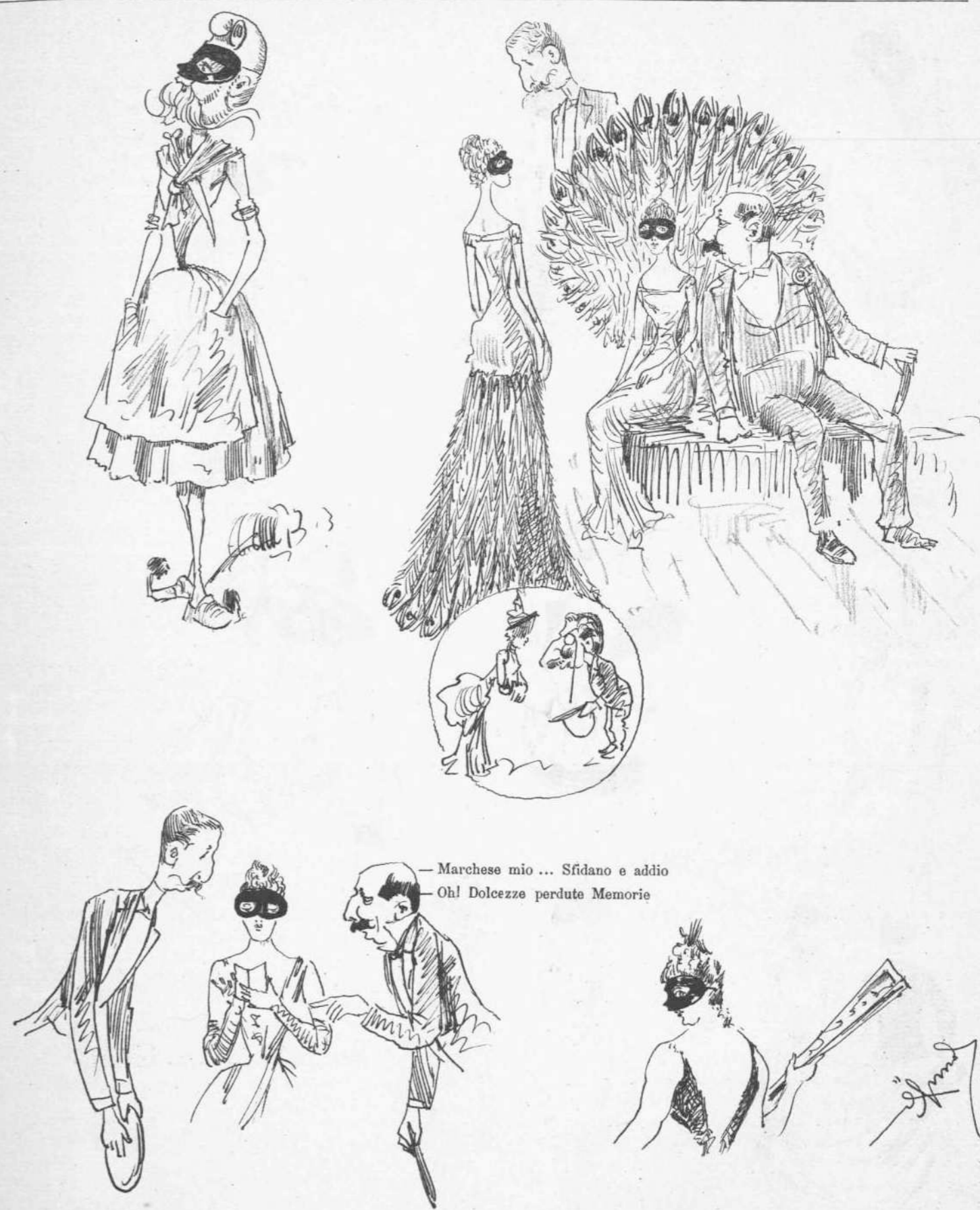
— Marchese mio ... Sfidano e addio — Oh! Dolcezza perdute Memorie