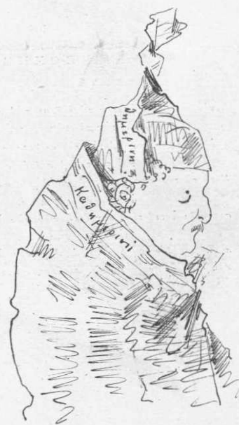
Ἀποχώρησις διά λόγους υγείας