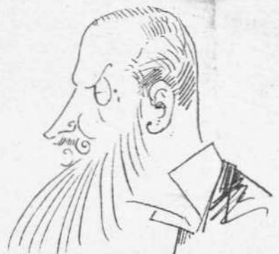
Περαισιτικός διά νά πάρη τὰ μπαγάγια του