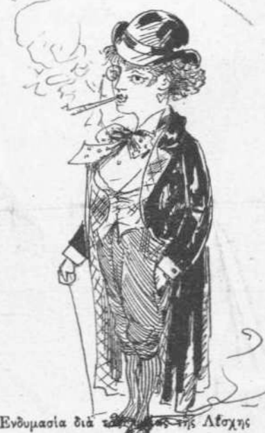
Ένδυμασία διά τῆς Ἀδοχῆς