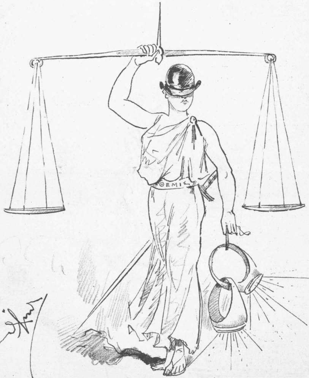
Σπεύδει μ' ἀνεσιν