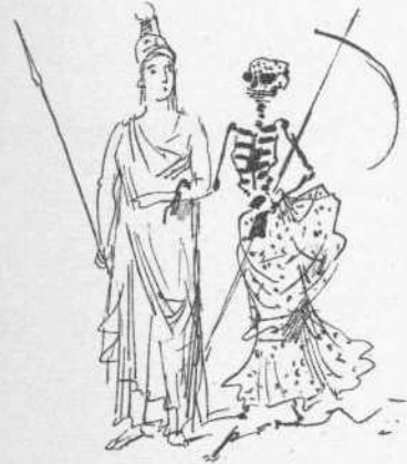
Ἀνά τὰς ἑθούς