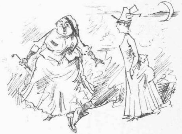
— Τι τρέχεις; — Ενόχτωσε και φοβούμαι να μην απαντήσω κανένα Ταμία