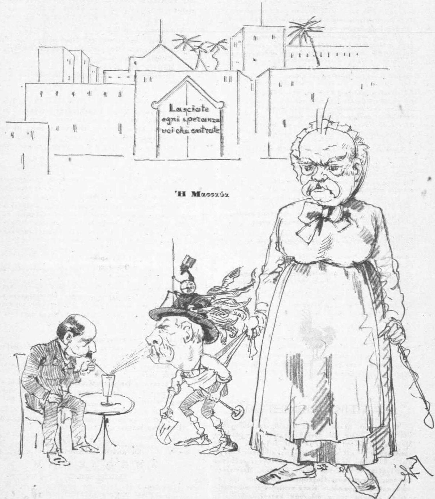
Crispino e la Comare