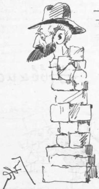
Ἐστοίχεψε ἐπὶ τίλου !