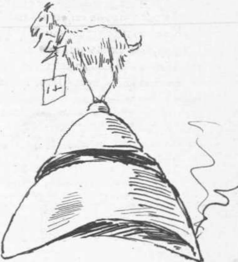
Εἰς ἀνάμνησιν τοῦ θεάτρου ἐν Φαλήρῳ