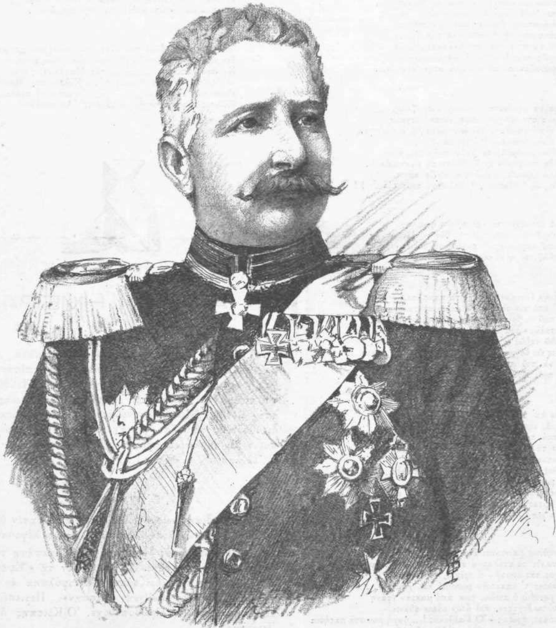
Ο ΣΤΡΑΤΗΓΟΣ ΒΑΛΔΕΡΣΕ Ο ΔΙΑΔΟΧΟΣ ΤΟΥ ΜΟΛΤΚΕ