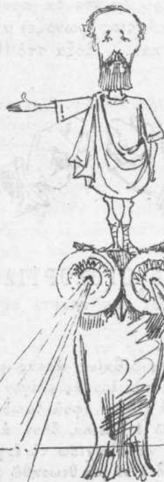
Τῆς πραγματικῆς σχολῆς.

«Αἰ πρὸς τὸν πεπολιτισμένον κόσμον σχέσεις τῆς ἡμετέρας πατρίδος κατέστησαν πραγματικώτεροι.»