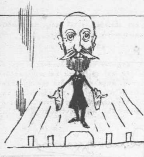
Κηρύσσει τήν έναρξιν του προτύπου έν τή 'Ανατολή Θεάτρου.