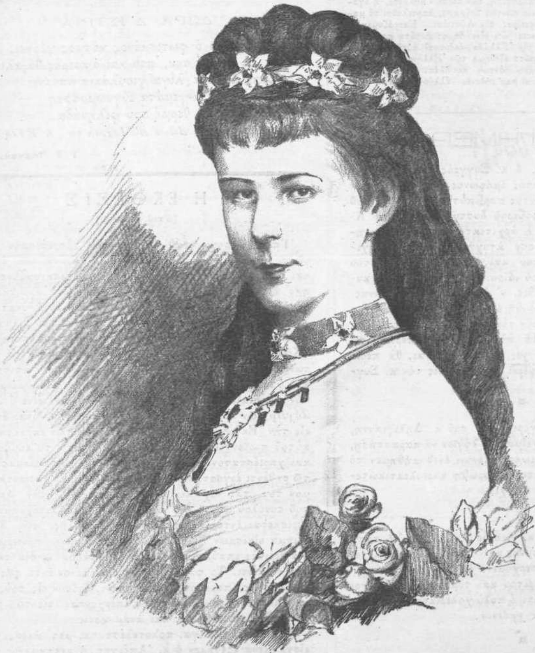
Η ΑΥΤΟΚΡΑΤΕΙΡΑ ΤΗΣ ΑΥΣΤΡΙΑΣ