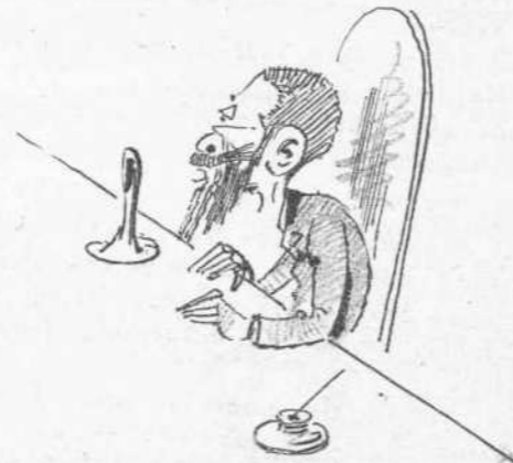
Κωλυμένου του Προέδρου της 'Επιτροπής των 'Ολυμπίων.