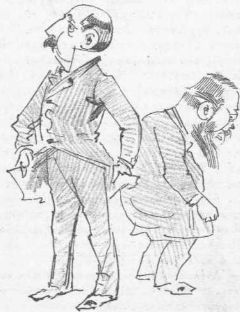
Τί κάμνει ή συμπολίτευσις.