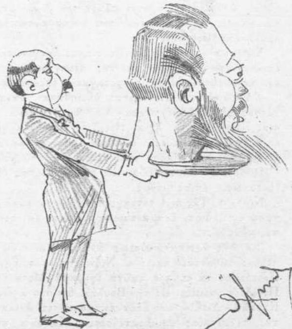
Τί ζητεῖ ή ἀντιπολίτευσις.