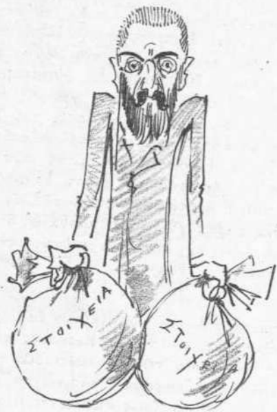
Πού εδρίσκειται ή υπόθεσις του νομισματικού μουσείου.