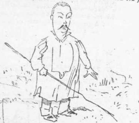
Πρώην ιδιοκτήτης γαλλοπούλων