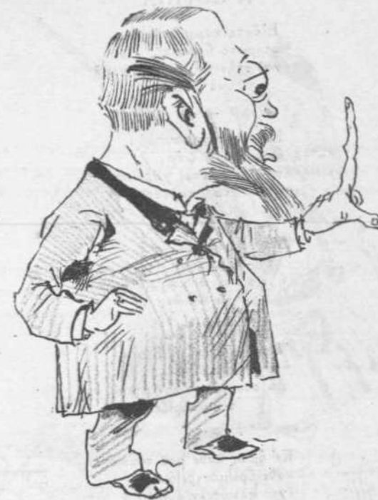
Ὅπισθεν τοῦ δακτύλου του.