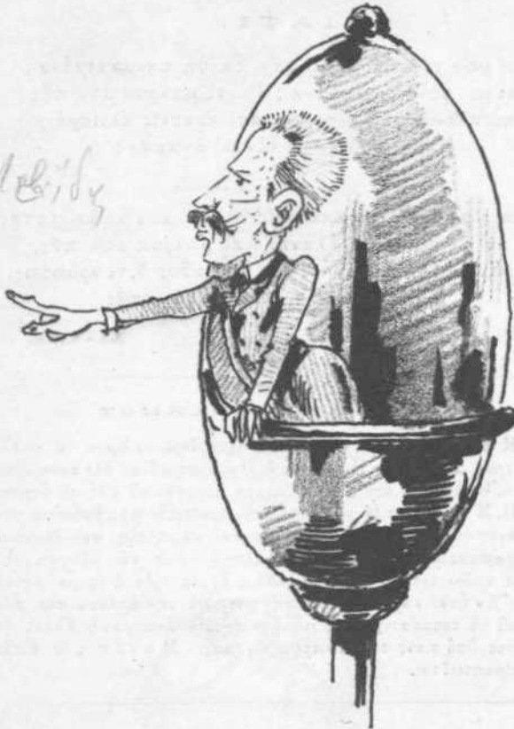
Κατάλληλον βήμα διά τούς βρωμερούς.