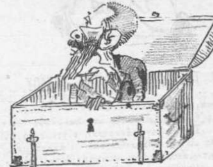
Διὰ τὴν Ἐκθεσὶν τῶν Παρισίων.