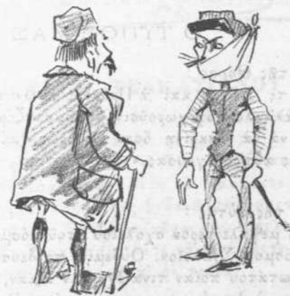
— Που εβάρεις ; — Εις τόν πετροπόλεμο!