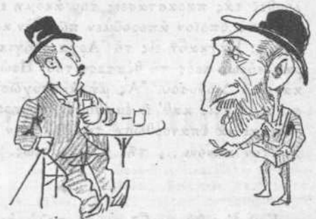
— Πάρε και σιγαρόχαρτο. — Δέν τό χρειάζομαι. — Έπρεπε να είνε υποχρεωτικόν και δια τούς αγοραστάς. — Περί σιγαροφίλων και σιγαροφύλλων θα γράψω εις τήν "Ακρόπολιν."