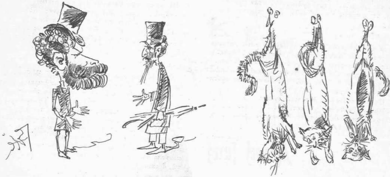
— Τίνες οι κριτικοί του δραματικού διαγωνισμού ; — Μόνοι ο πρόεδρος της επιτροπής είνε ... κρητικός;