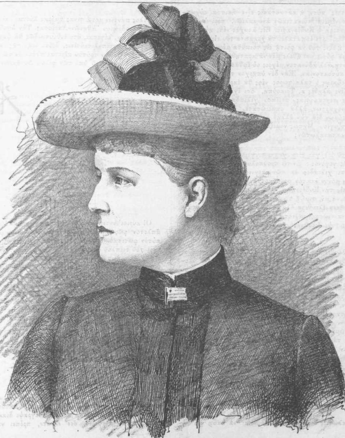
Ἡ ΠΡΙΓΚΙΠΙΣΣΑ ΑΛΕΞΑΝΔΡΑ