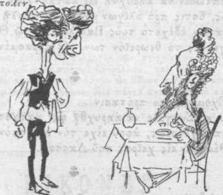
— Φέρε μου αταρίδα δι' επιδόσκειον. — Δέν έχουμε. — Δέν έννοείται, ότι δια της χρήσεως έν 'Ελλάδι ως επιδοσκειου της αταρίδας λύεται τό μέγα ζήτημα.