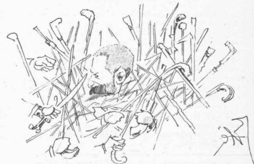
Τσελλερατῆς καὶ ἀντιτσελλεραταί.