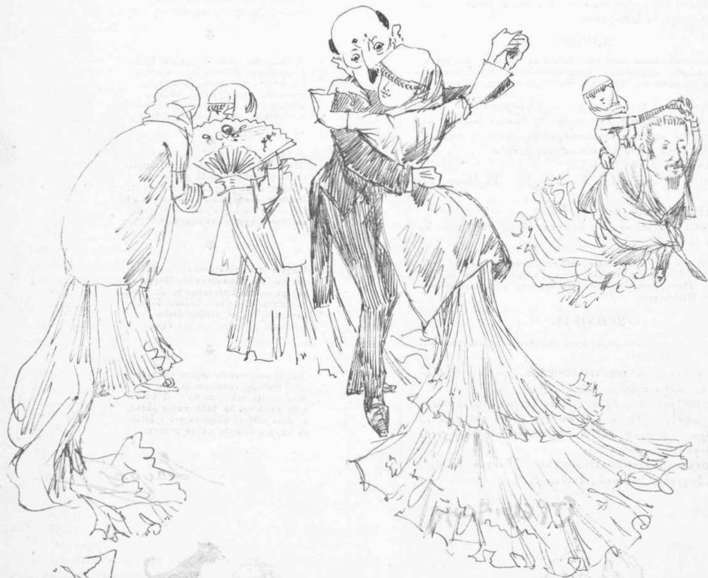
Ἡ ἐπίσημος στολή τῶν Κυριῶν.