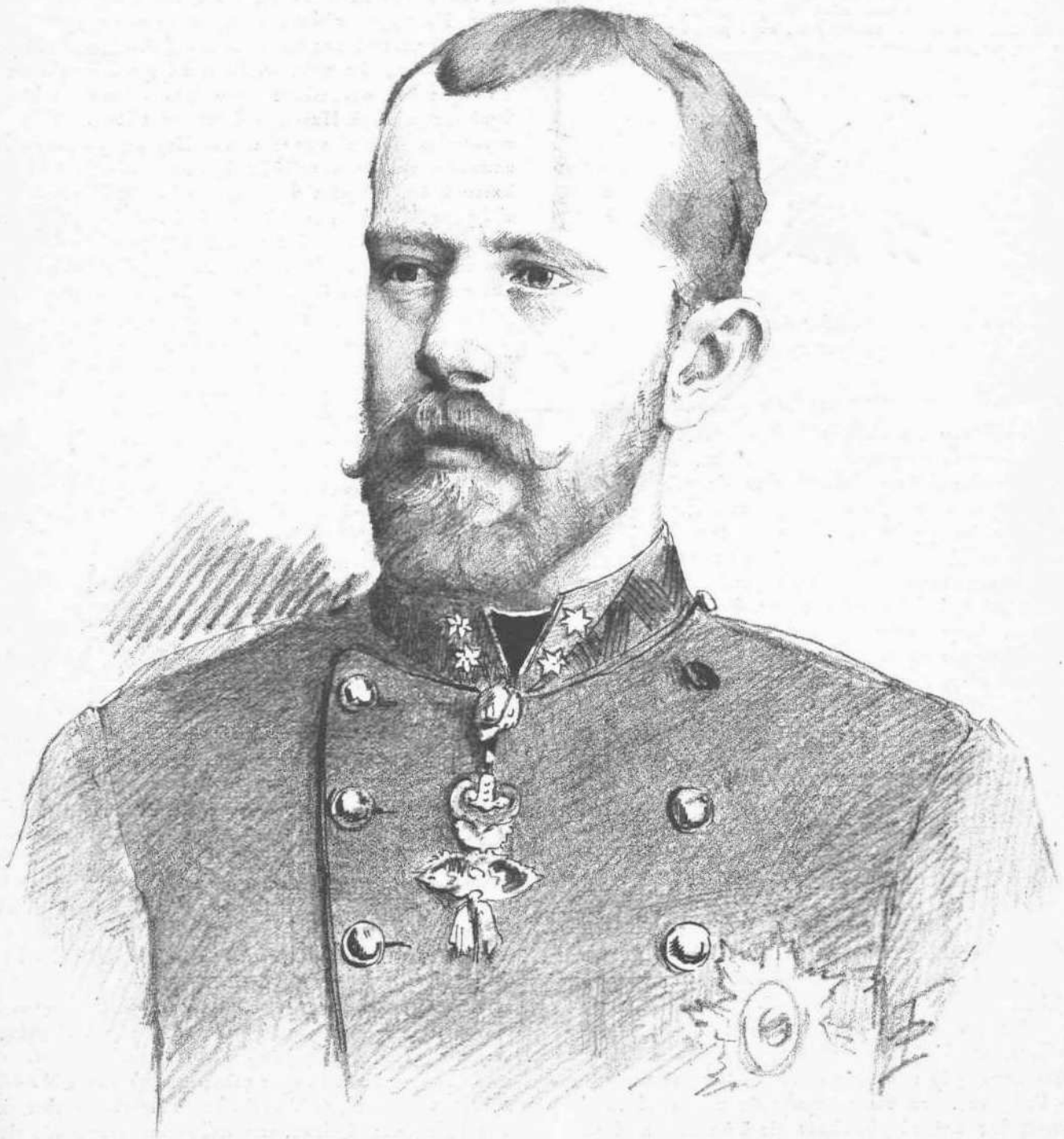
Ὁ αὐτοκτονήσας διάδοχος τῆς Αὐστρίας ΑΡΧΙΔΟΥΕ ΡΟΔΟΛΦΟΣ