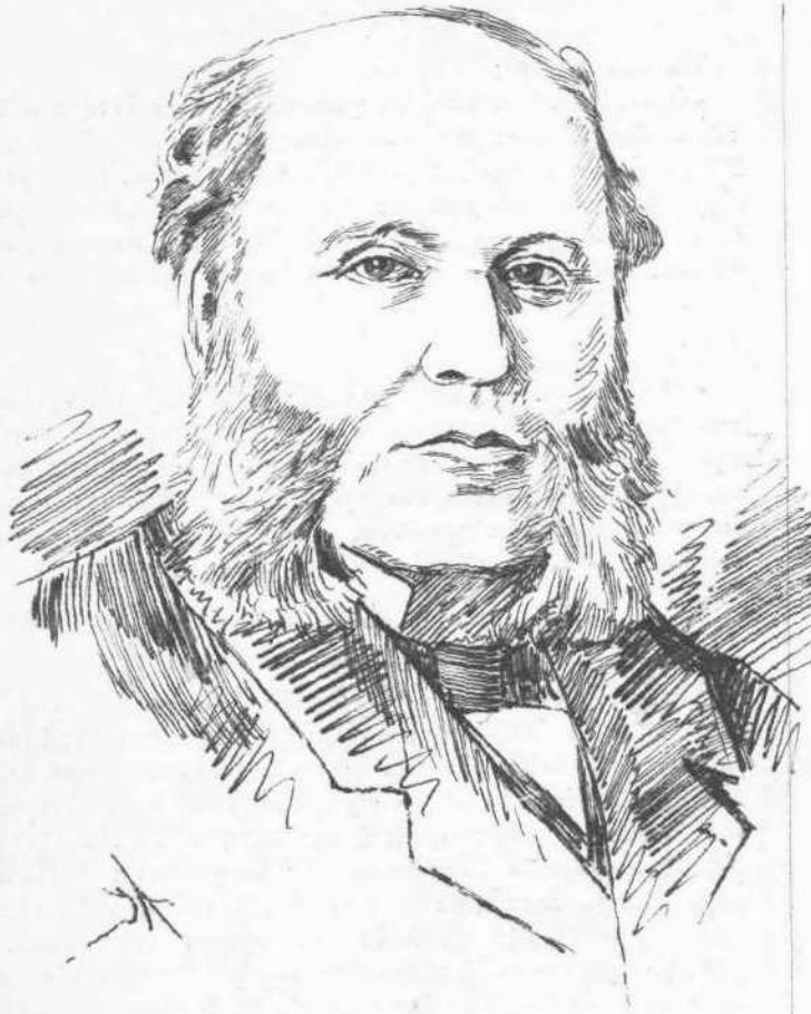
Ο sir ROBERT MORIER

Γεώργ. Θά τ' ἔδητε δημοσιεύμενον εἰς ἐπόμενον φύλλον. — Γάτα. Σὰς παραπέμπομεν εἰς τὸν κ. Μηλιαράκη καὶ τὸ ποιῆμά σας εἰς χειροῦρον δυνάμενον νὰ τοῦ διορθῶσιν τοὺς πόδας. — Φίλω Μυθιστορημάτων. Σὰς συνιστῶμεν τὸ εἰκονογραφημένον περιοδικόν "Ἐκλεκτὰ Μυθιστορήματα" ἐν ᾧ θὰ εὕρητε οὐ μόνον τὸ ζητούμενον, ἀλλὰ καὶ ἄλλα πολὺ καλλίτερα.