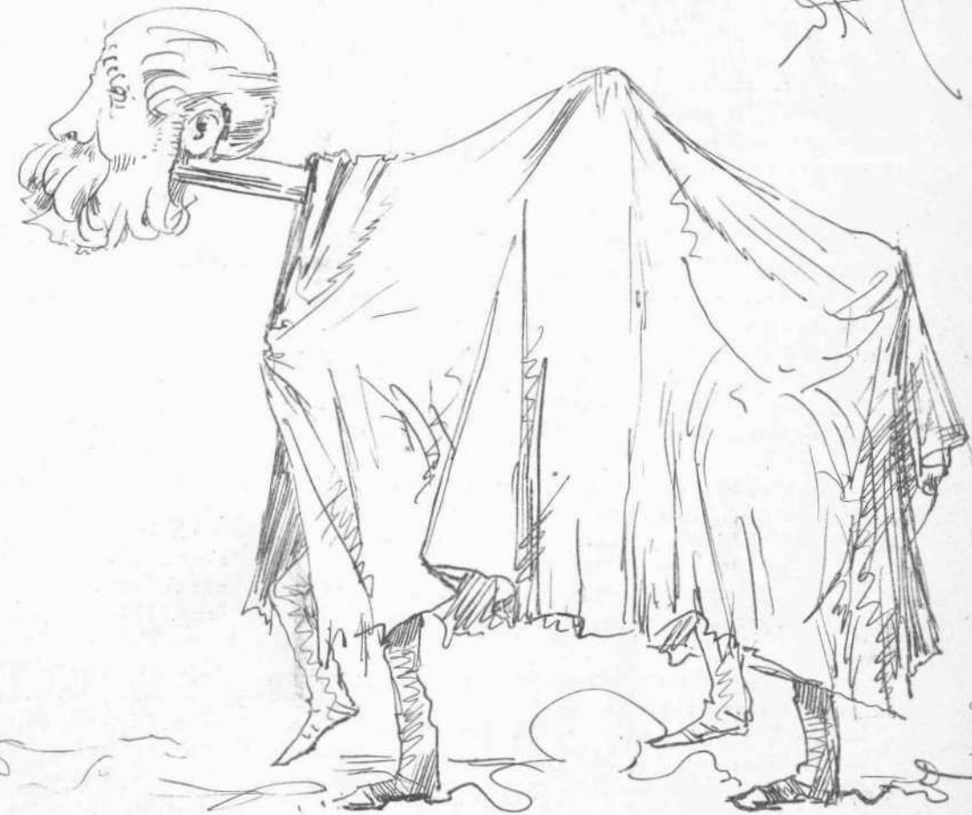
Ἡ ἑλληνικωτέρα μασκαράτα.