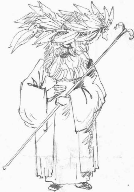
Ο ύποψήφιος του "Αστειος Μητροπολίτης