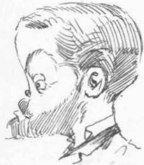
Σύγχρονος μέγας άνήρ. (Ex. του Univers Illustré)