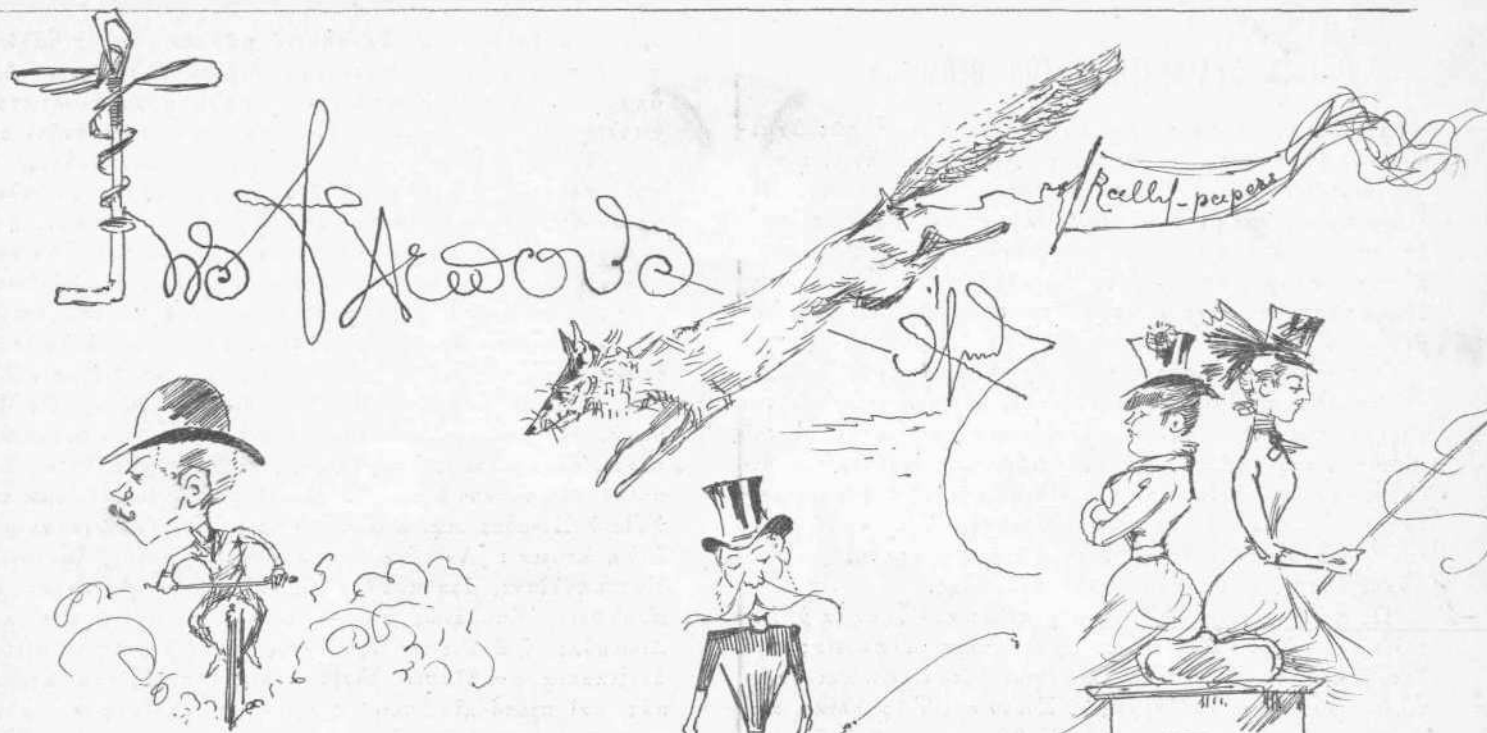
Διὰ τὴν σκωπὴν τὴν Ἀλεποῦ.