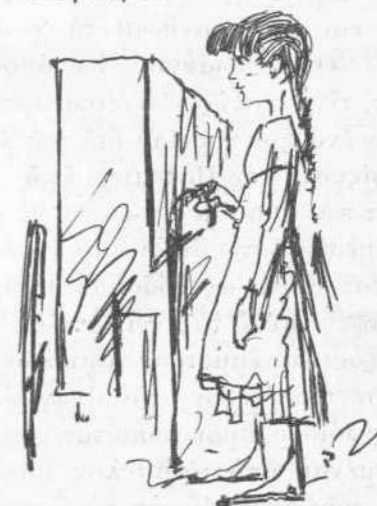
Καὶ αὐτὴ μία τῶν πληγῶν τῶν Ἀθηνῶν.