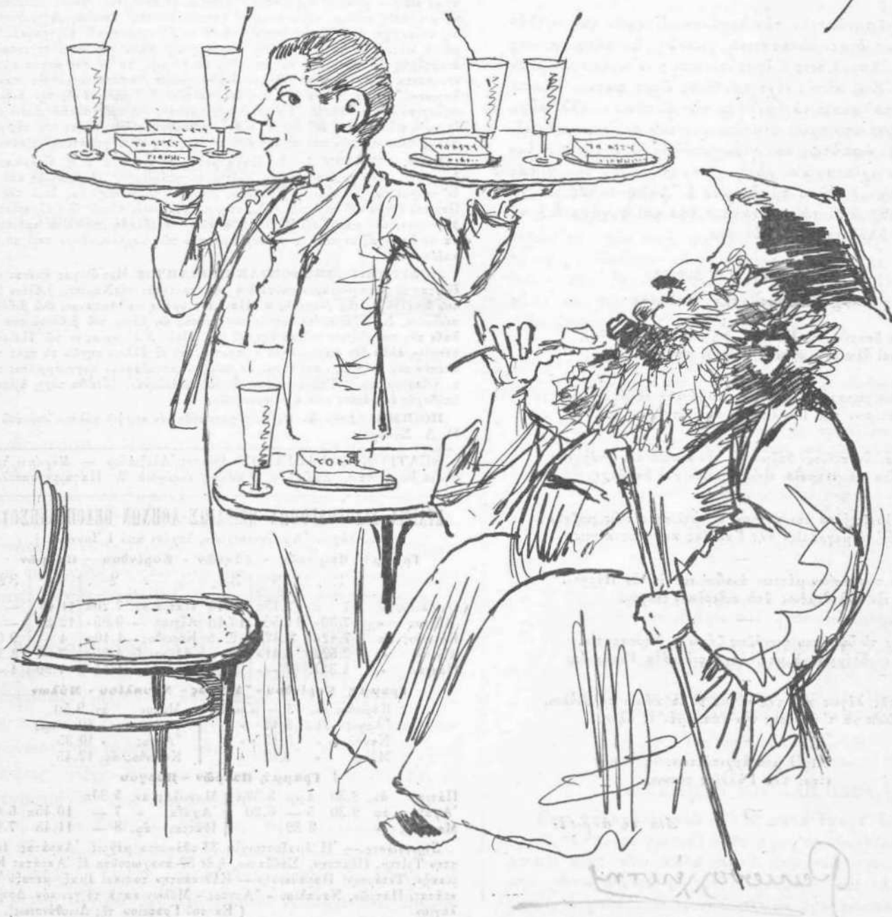
Με τέτοιο παγωτό λησμονεί κανείς και τόν Μητροπολιτικό θρόνο.

Handwritten signature or initials in the upper right corner of the page.