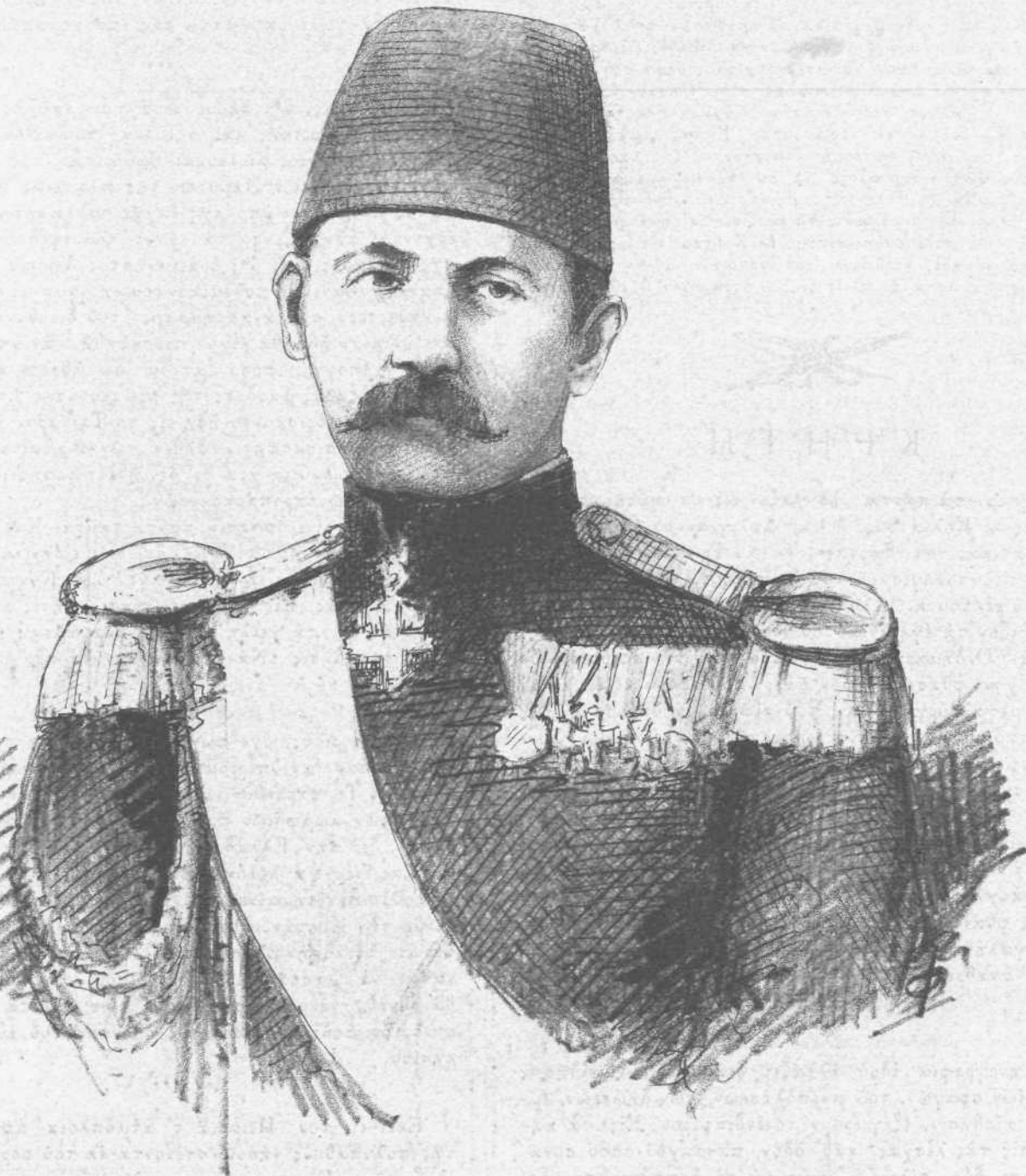
Ο ΣΤΡΑΤΗΓΟΣ ΑΖΕΒΑΤ ΠΑΣΣΑΣ