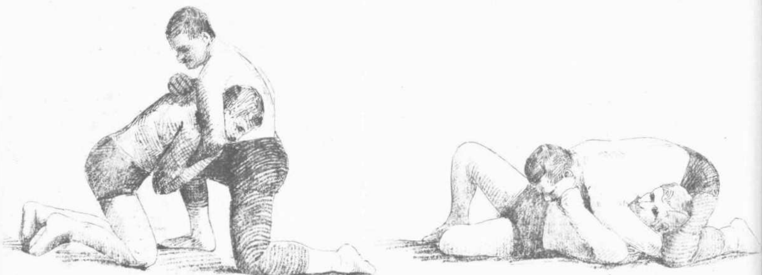
Ὁ ἐν Ἀμερικῇ Ἕλλην παλαιστής Γεώργιος ὁ Νικητής.