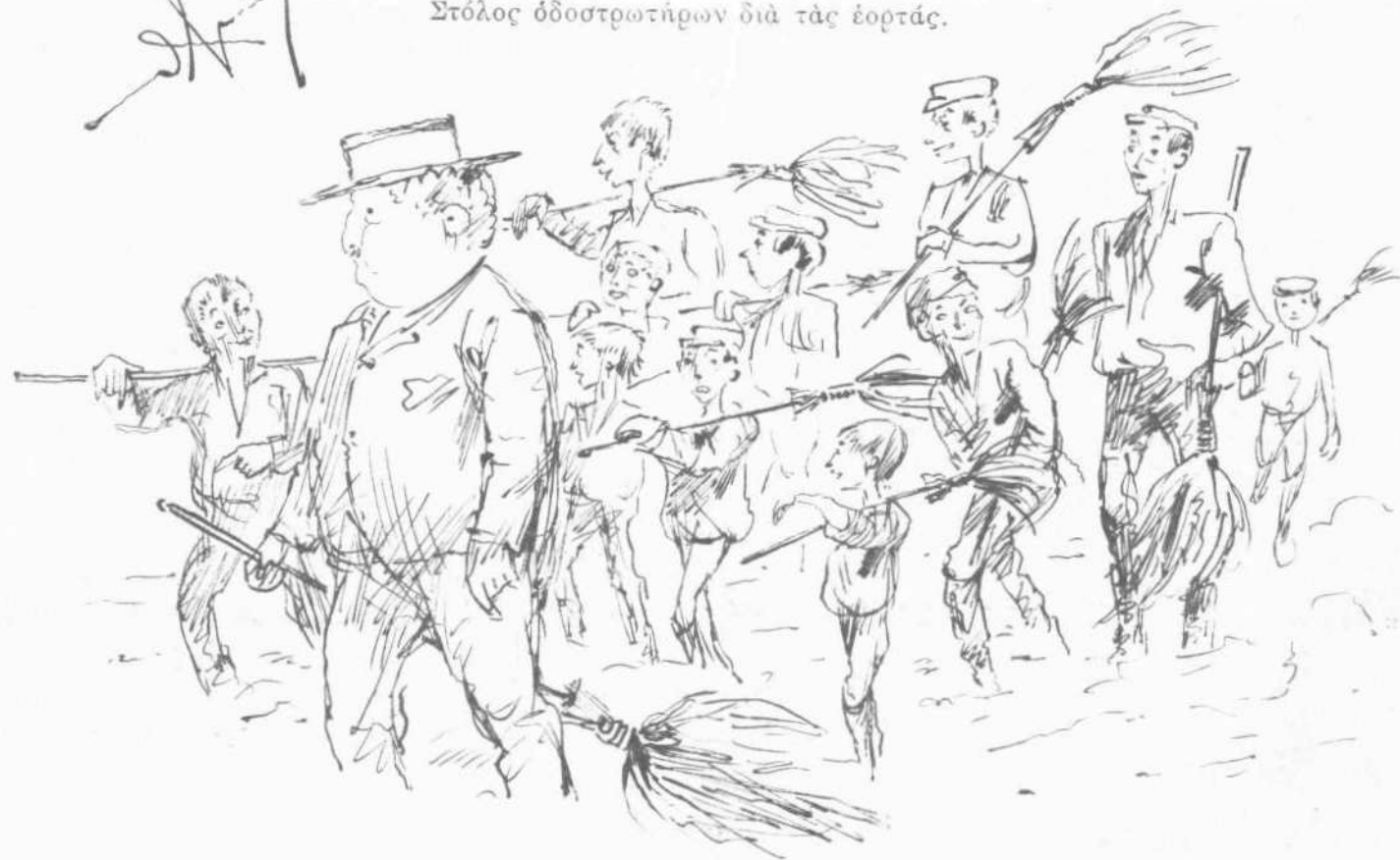
Χρησιμοποίησις ἀπόρων παιδῶν διὰ τὰς ἐορτὰς.