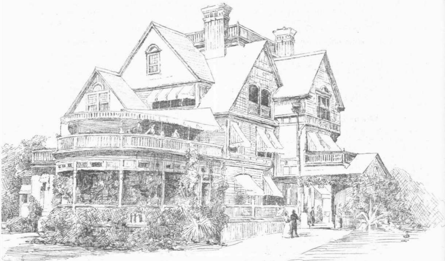
Κατοικία του ΕΥΖΩΝ.