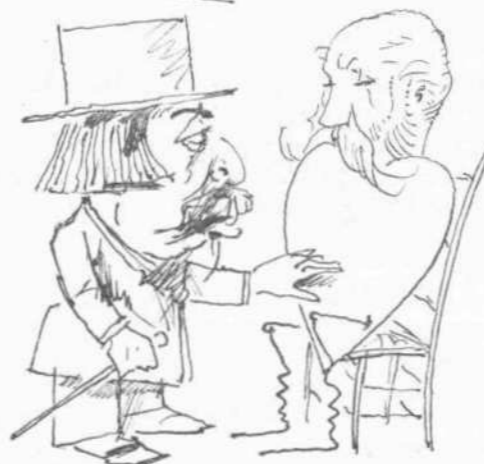
Πάσχει ἀπὸ παλμύρρεια.