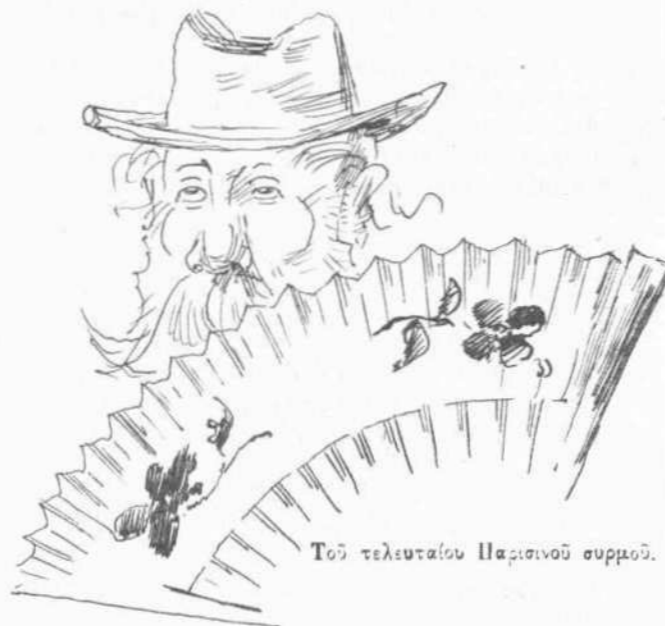
Τὸ τελευταῖον Παρισινὸν συρμόν.