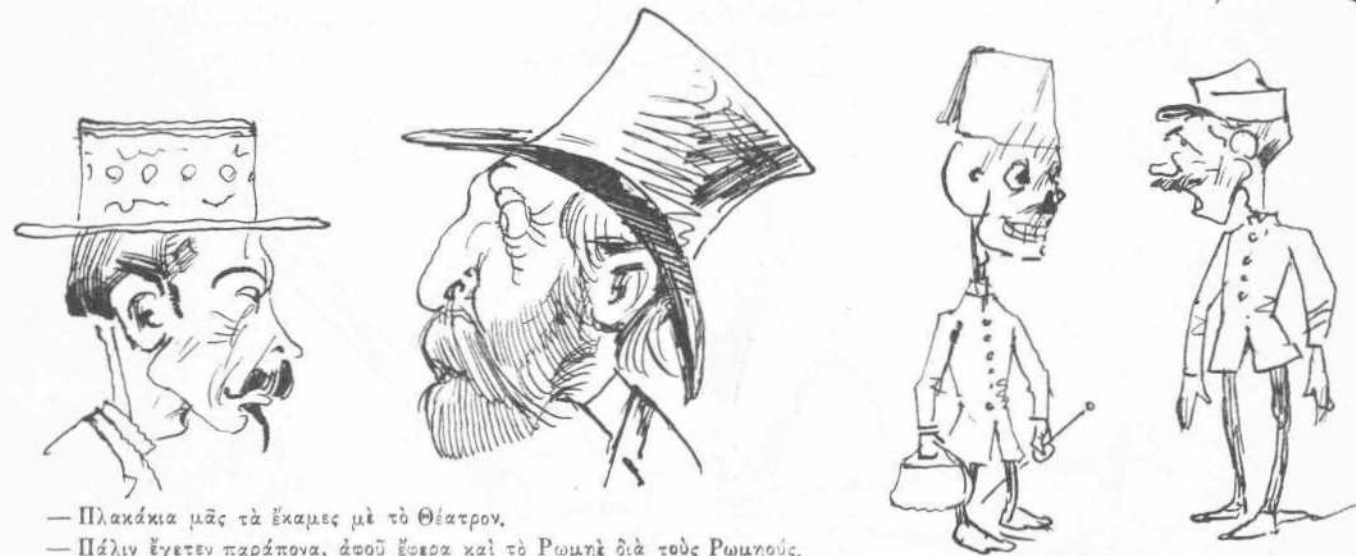
— Πλακάκια μᾶς τὰ ἔκαμες μὲ τὸ Θέατρον. — Πάλιν ἔχετεν παράπονα, ἀφοῦ ἔφερα καὶ τὸ Ρωμῆ διὰ τοὺς Ρωμηοὺς.