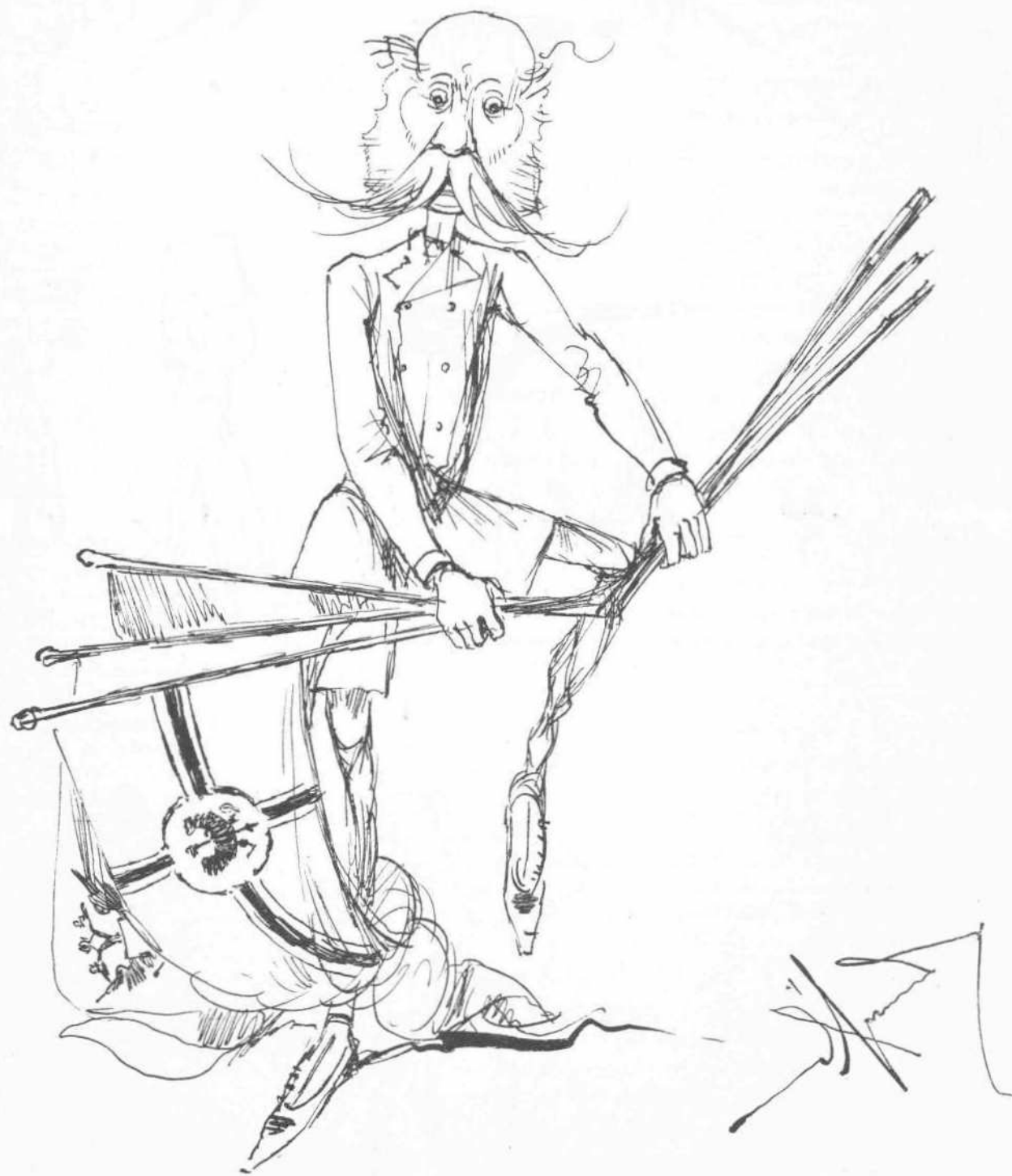
Τὸ σπάσιμο τῆς τριπλῆς συμμαχίας.