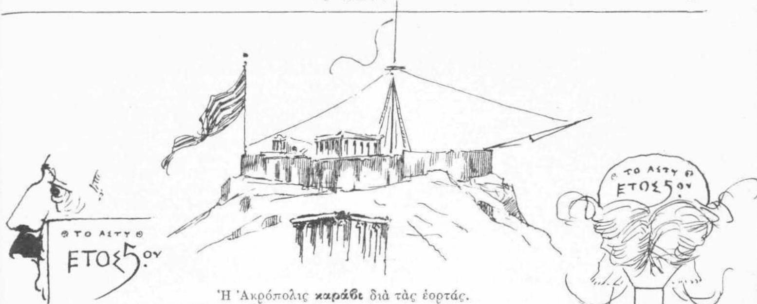
Ἡ Ἀκρόπολις καράβι διὰ τὰς ἐορτὰς. (Ἰδέα τοῦ Ὑπουργείου τῆς Παιδείας καὶ τῶν Ναυτικῶν).