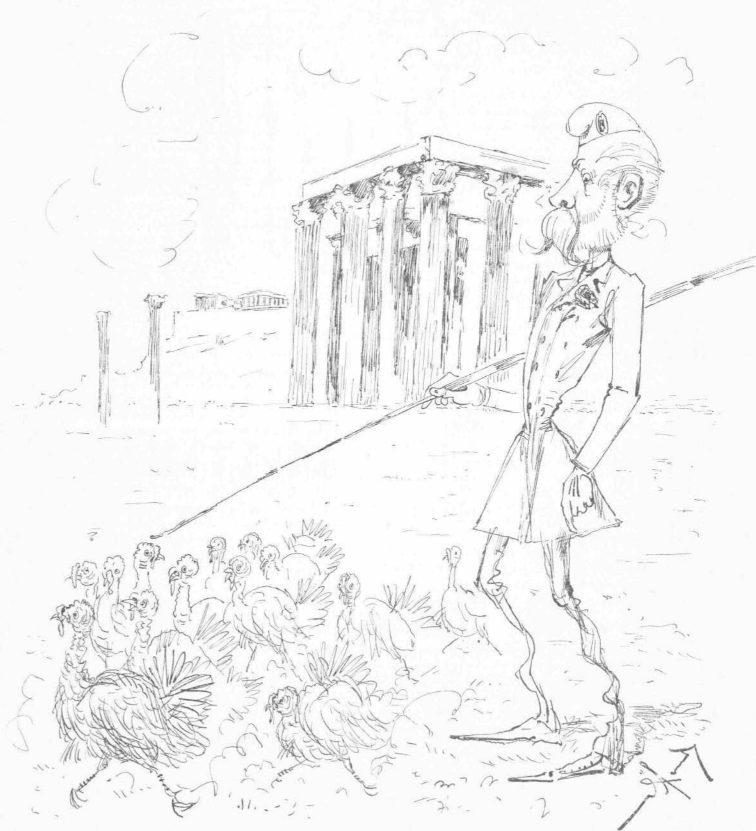
Διαδύλωσις κατὰ τῆς Γερμανικῆς πολιτικῆς.