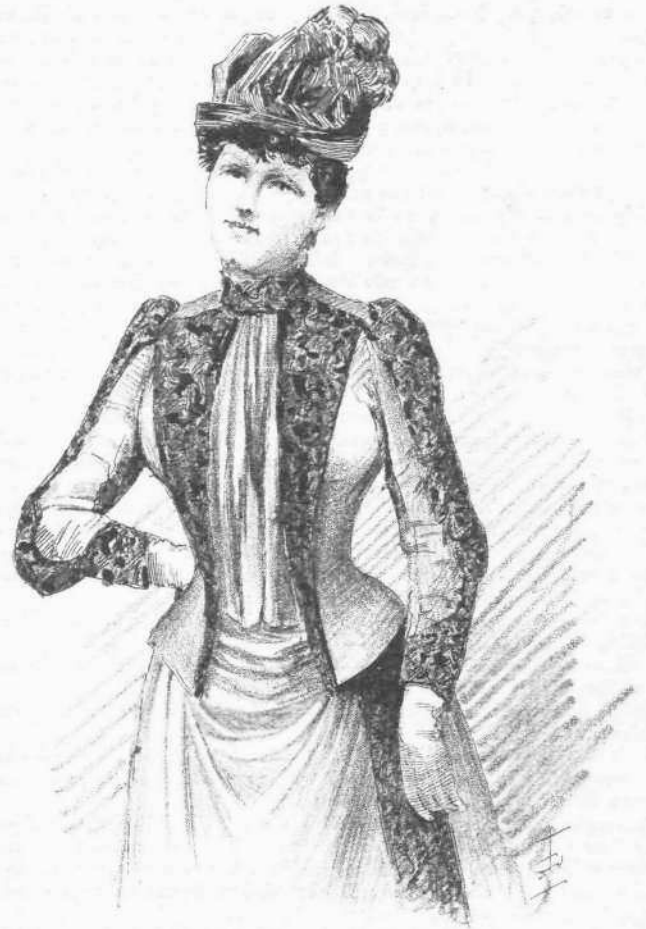
Φθινοπωριναί ένδυμασίαι του τελευταίου Παρισινού συρμού.