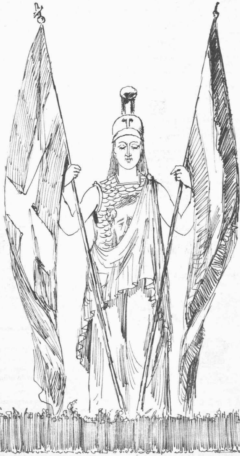
Ἡ ὑποδοχὴ τῆς Παλλάδος