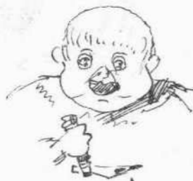
Ὁ πατροκτόνος Καρυδόπουλος (Πρὸ τοῦ φόνου).