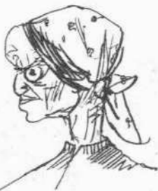
Ἡ παιδοκτόνος Ζαχαρούλα Καραμερτζάνη.