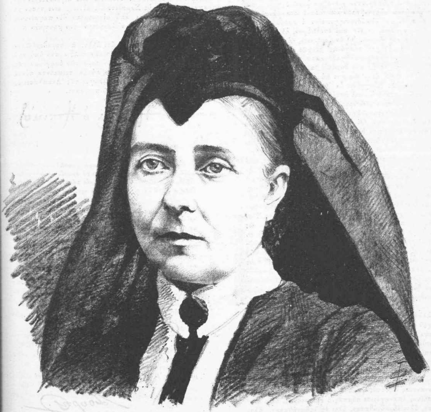
Ἡ ΑΥΤΟΚΡΑΤΕΙΡΑ ΦΡΕΙΔΕΡΙΚΟΥ