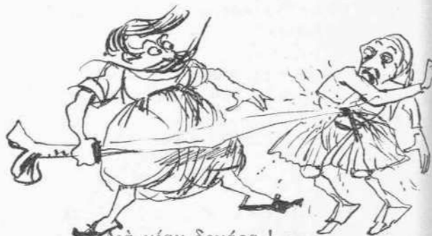
Διὰ μίαν δεκάρα! (Ἡ ἀνάκρισις ἐπὶ τὰ ἔχνη).