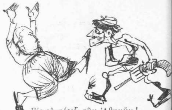
Εἰς τὰ πέριξ τῶν Ἀθηνῶν!