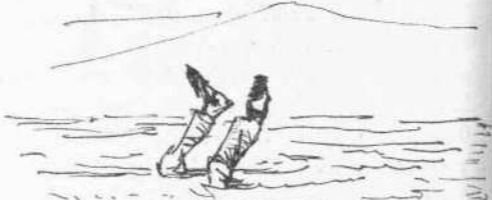
Εἰς τὸν Σαρωνικὸν κόλπον.

(Ἐκ τῶν ὑποδημάτων τοῦ κατασκευασθέντων εἰς τὸ γνωστὸν κατάστημα τοῦ Περπινιά προκύπτει ὅτι ὁ νέος εἶνε καλῆς οἰκογενείας).