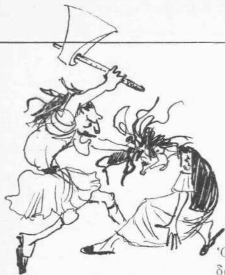
Ὁ πρωτοεργός τοῦ ἐν Λαυρίῳ δράματος Ν. Μουστακάκος.