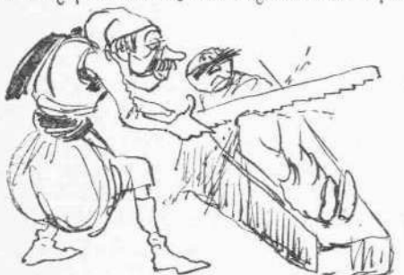
Πρωτοφανὲς μαρτύριον. (Ἔλαβε χώραν εἰς Ἀδριανούπολιν. Ὁ δράστης δὲν συνελήφθη).