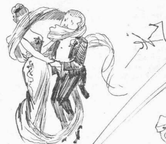
Ὁ οὐρὰ καὶ πάλιν τοῦ συρμού.