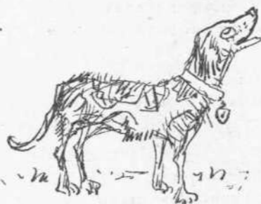
Ὁ κύων τῆς οἰκογενείας τῶν Κορδογιαννοπούλων.