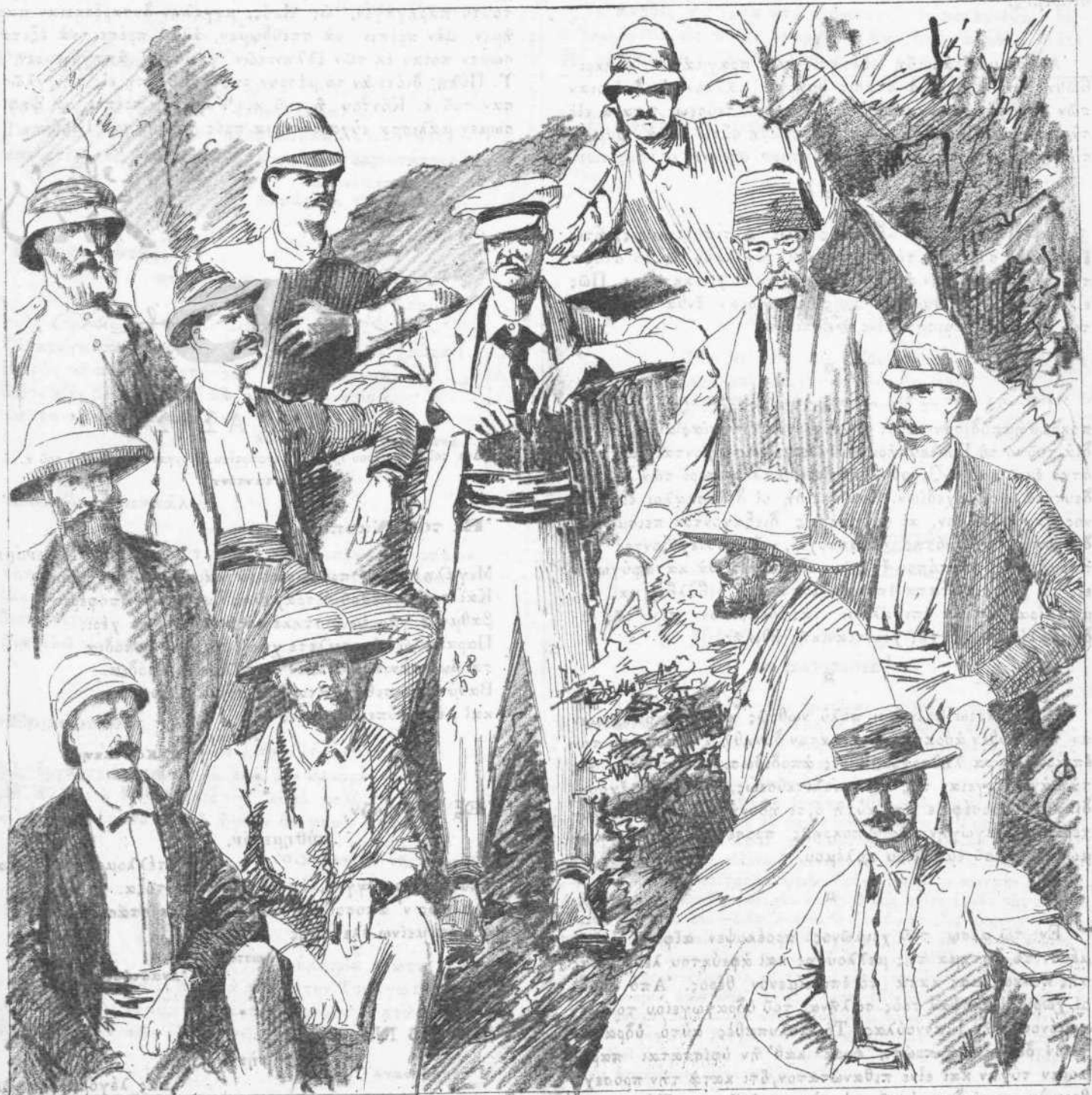
Ο ΣΤΑΝΔΕΥ (και τὸ ἐπιτελεῖόν του.