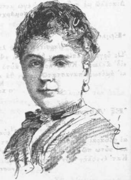
Gabrielle Bompard. (Πρό τοῦ ἐγκλήματος).