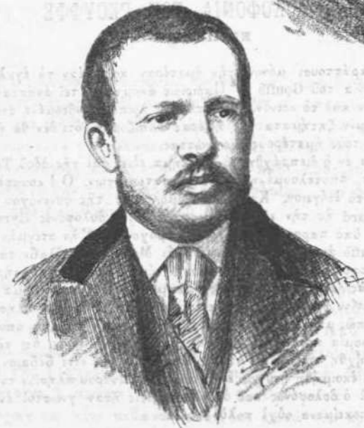
Ο δολοφόνος Eyraud.