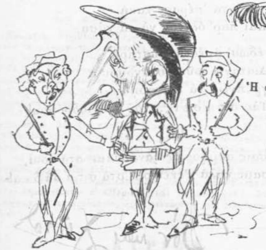
Ἡ στάσις τῆς Ἀντιπολιτεύσεως.