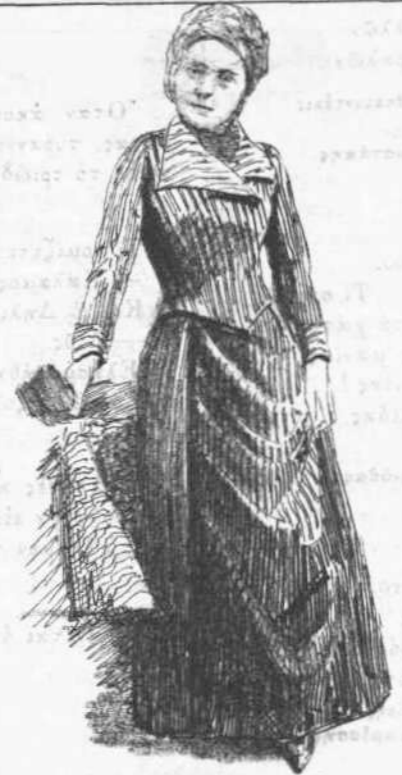
Gabrielle Bompard. (Φωτογραφία της Αστυνομίας).