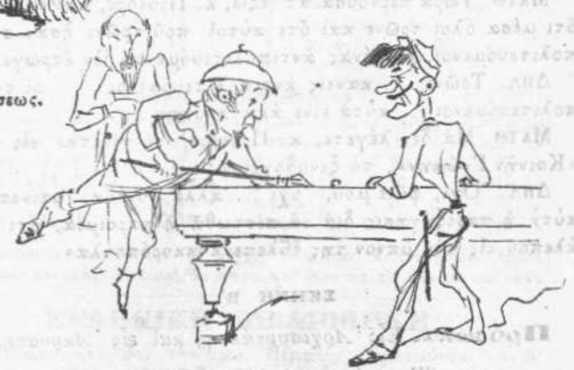
Ἐπὶ ὄψιν τοῦ Κομητάτου τῆς Σύρου.