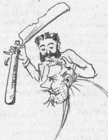
Δύναμις τῶν πρώτων τριχῶν.