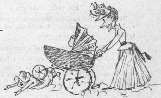
Εἰς τὴν ὁδὸν Φιλελλήνων.