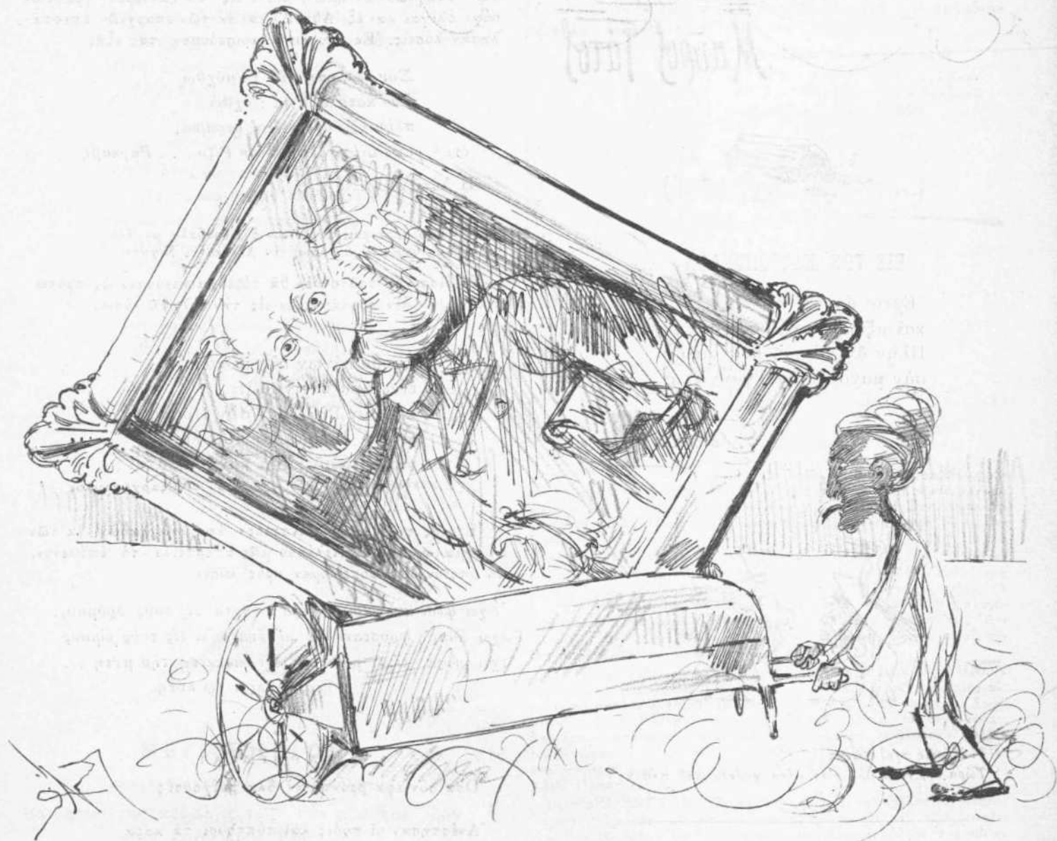
Ἡ Ἀλεξανδρινὴ Εἰκὼν

Ἄλλα τὰ χεῖλη τῶν ἀσεβῶν τῶν μὴ προσκυνούντων τὴν εἰκόνα τοῦ τῆν σεπτῆν . . .