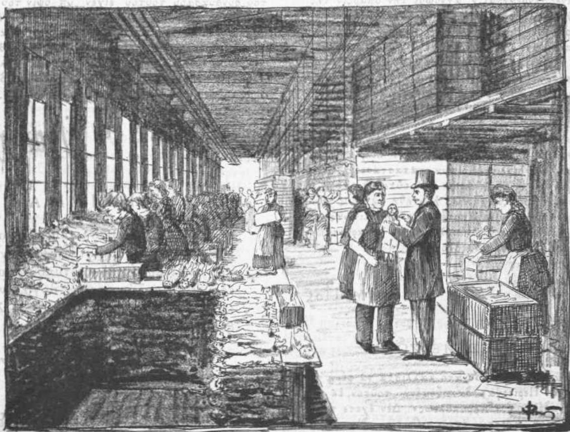
Κατάστημα ἱματισμοῦ καὶ συσκευῆς πλαγγόνων Ἐδισσῶν.