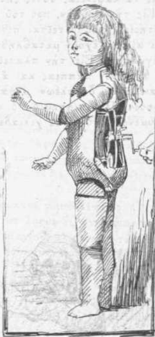
Πλαγγὼν Ἐδισσῶν γυμνή.