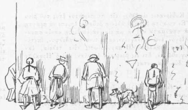
Τὰ ἀγάλματα εἰς τὸ Θέατρον τοῦ κ. Συγγρού.