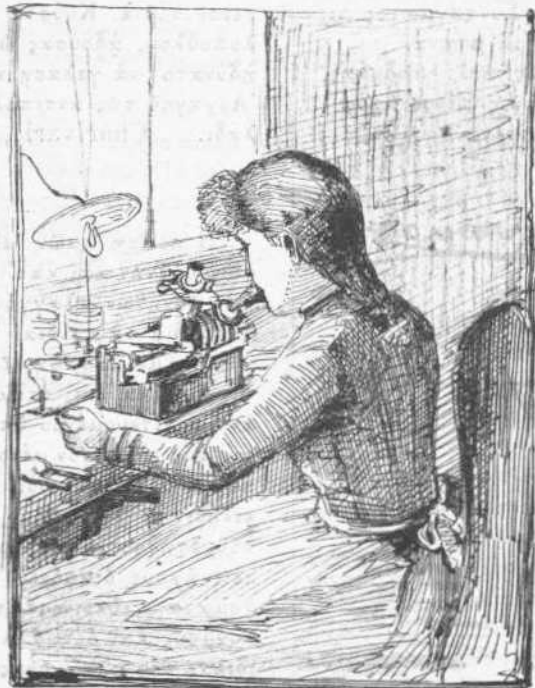
Προπαρασκευὴ φωνογράφου πλαγγόνος Ἐδισσῶν.