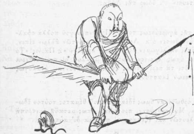
Τὸ τέλος τῆς Ἀθηναϊκῆς.