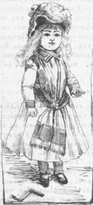
Πλαγγὼν Ἐδισσῶν ἐνδεδυμένη.