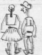
Ὁ πυρὴν τοῦ ἐν Ἀττικῇ ἀνεξαρτήτου συνδυασμοῦ.

— Τί σκοπὸν ἔχει ὁ σκοπός ; — Διὰ νὰ μὴ χλέπτουν ἀπ' ἡμῶν.