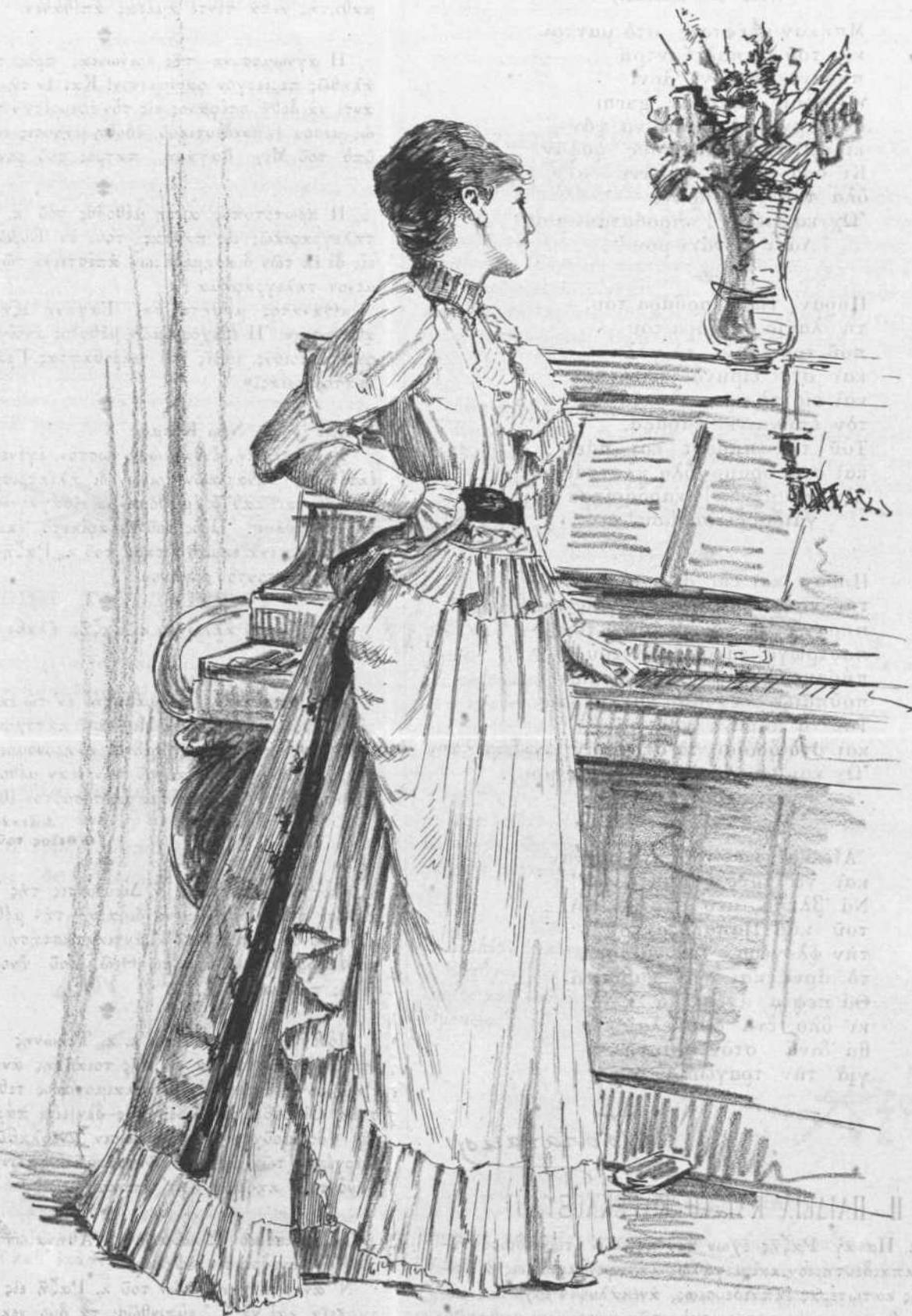
Ὁ τελευταῖος συμμῶς.