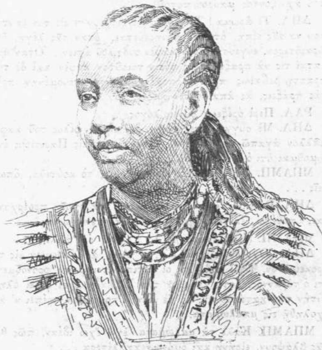
ΤΑΪ-ΤΟΥ Σύζυγος τοῦ Μενελίκ.

κτασιν τῶν παλαιῶν κήσεων εἰς τὴν Ἀφρικὴν, εἰς τὴν ὁποίαν ἀρμόζει ἤδη μᾶλλον ἢ εἰς τὴν Ἀμερικὴν ὁ τίτλος τοῦ νέου κόσμου.