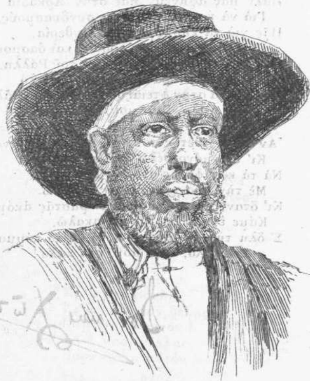
ΜΕΝΕΛΙΚ Αὐτοκράτωρ τῆς Ἀθιοπίας.