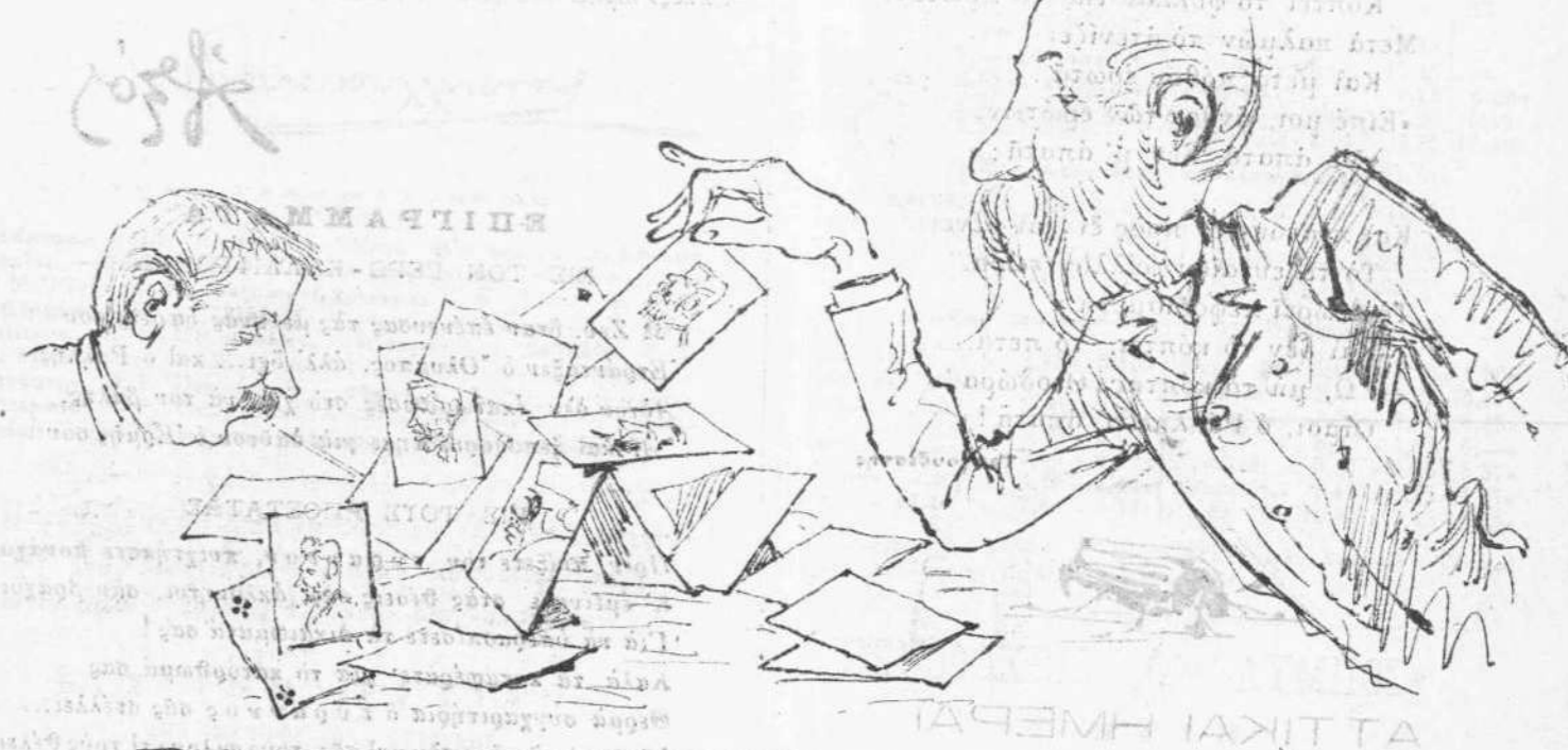
Ἡ κωμῳδία τῆς παρελθούσης ἐβδομάδος.