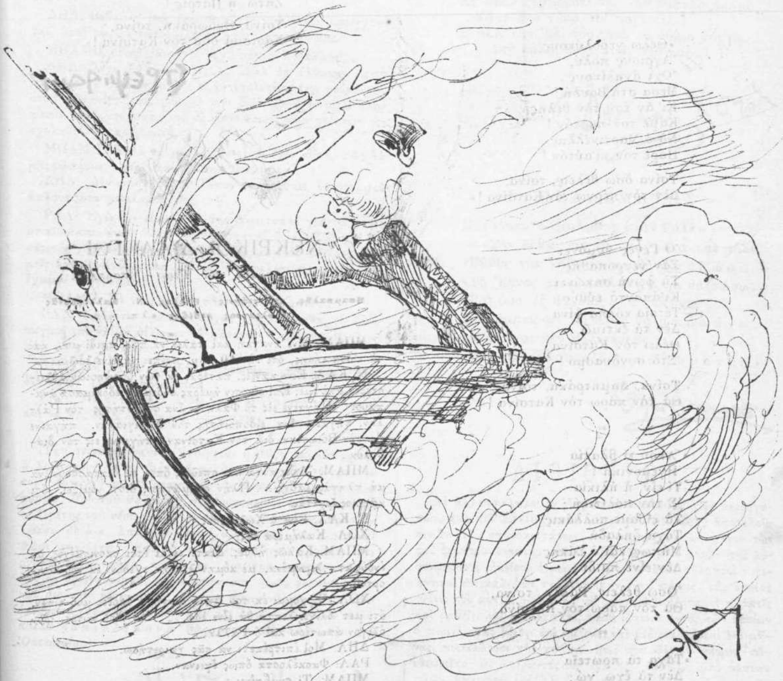
Ἡ πρώτη θαλασσοφουρτούνα τῆς Ἀντιπολιτεύσεως