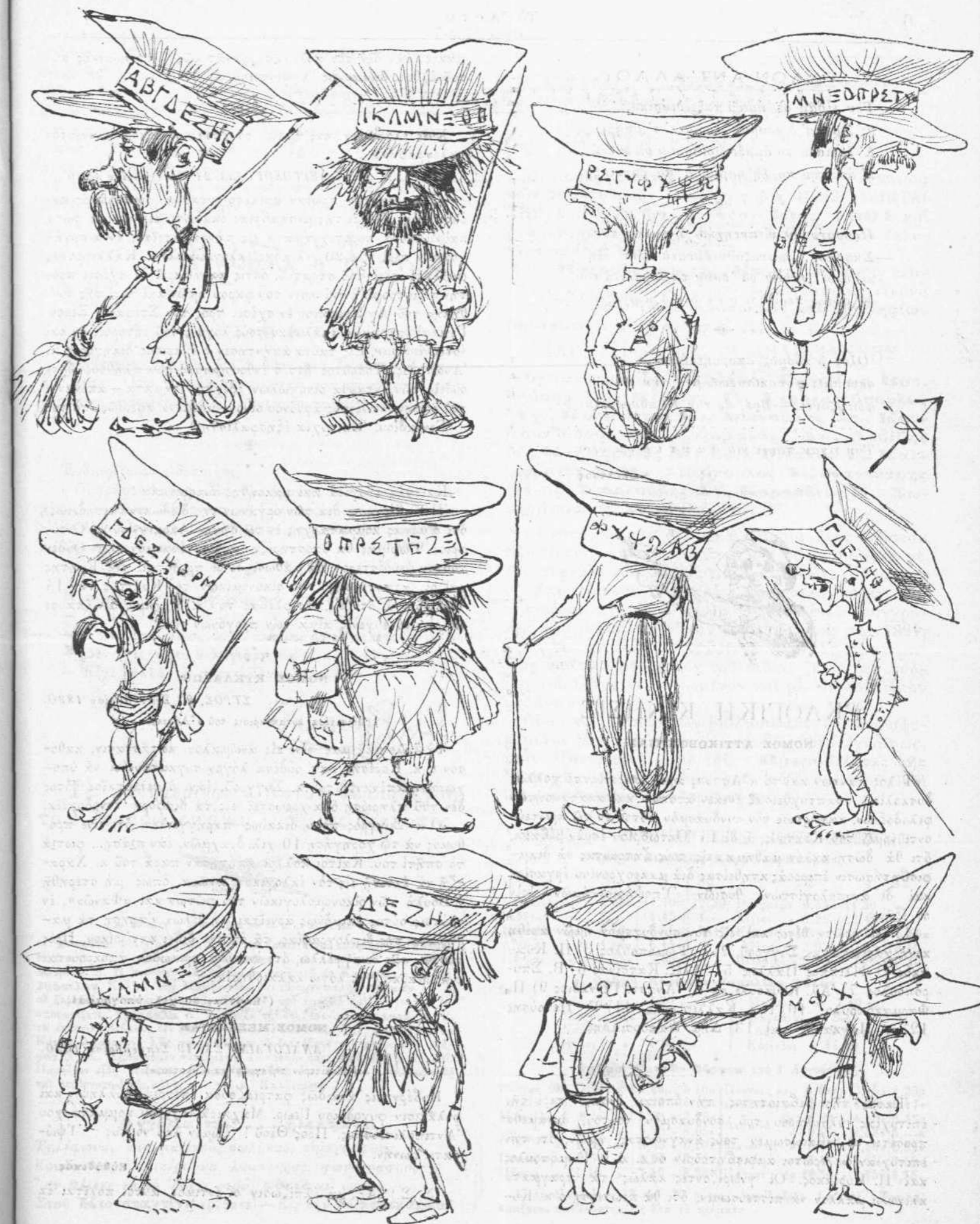
Έκτακτον φαινόμενον καθαριστών έν 'Αθήναις.