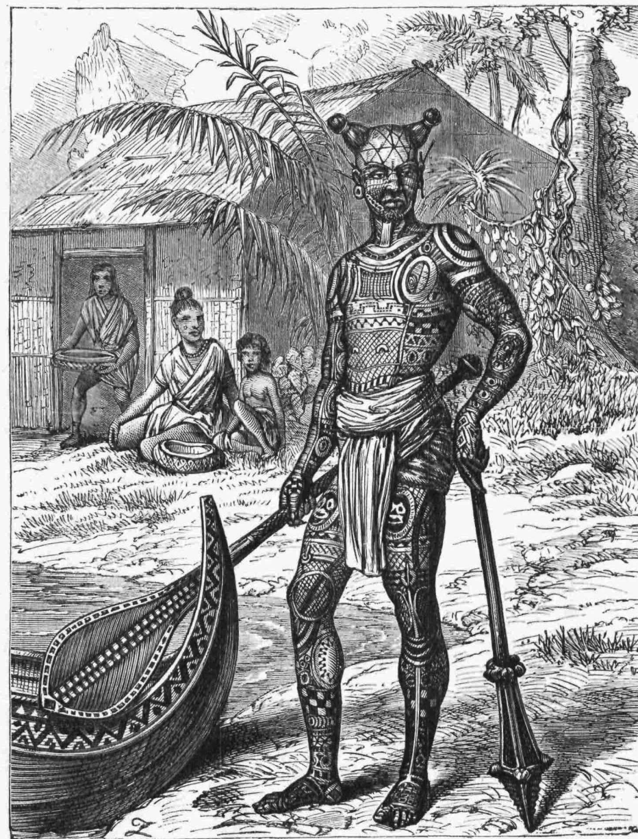
ΠΟΛΕΜΙΣΤΗΣ ΤΗΣ ΜΑΡΚΟΥΕΣΣΗΣ.