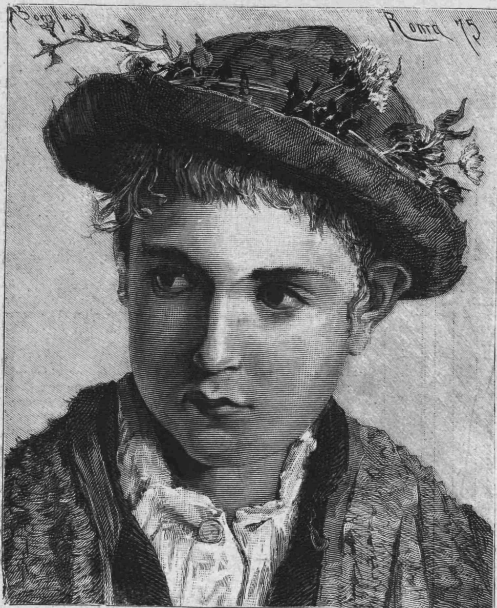
ΑΘΩΟΤΗΣ ΚΑΙ ΝΕΟΤΗΣ