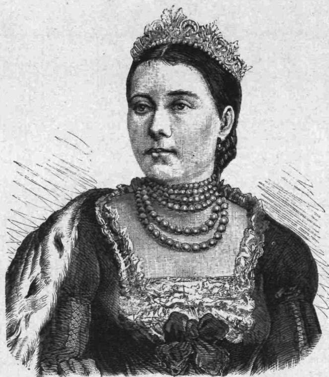
Ἡ Αὐτοκράτειρα Φρειδερίκου