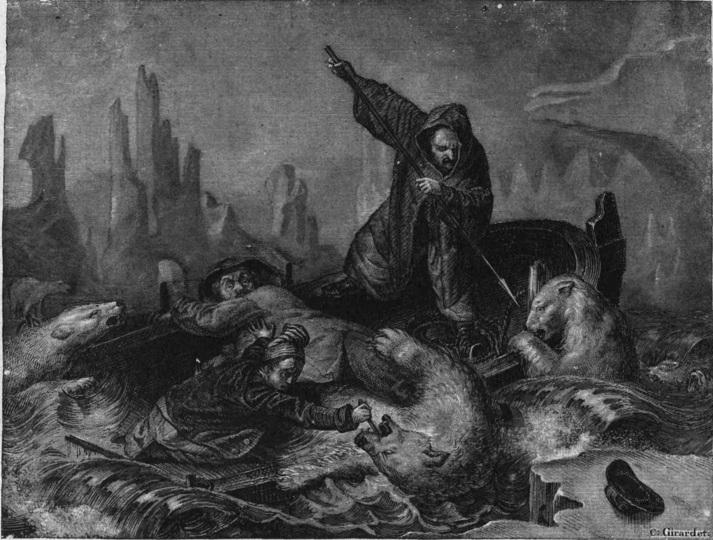
ΘΗΡΑ ΠΡΟΣ ΤΡΕΙΣ ΛΕΥΚΑΣ ΑΡΚΤΟΥΣ