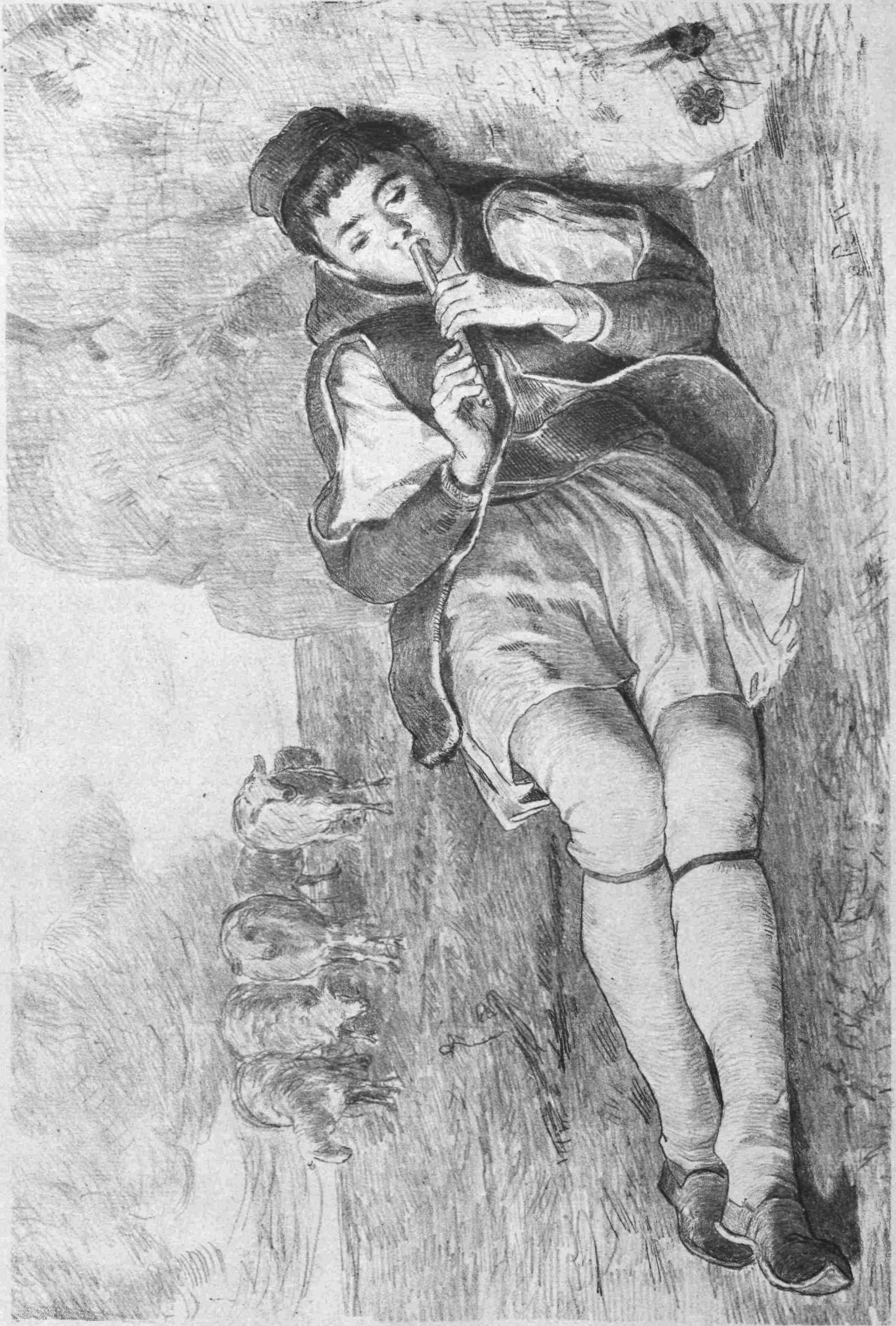
ΠΟΙΜΗΝ ΠΑΙΖΩΝ ΤΟΝ ΑΥΛΟΝ — ΝΕΩΤΑΤΟΝ ΕΡΓΟΝ Π. ΛΕΜΠΕΣΗ