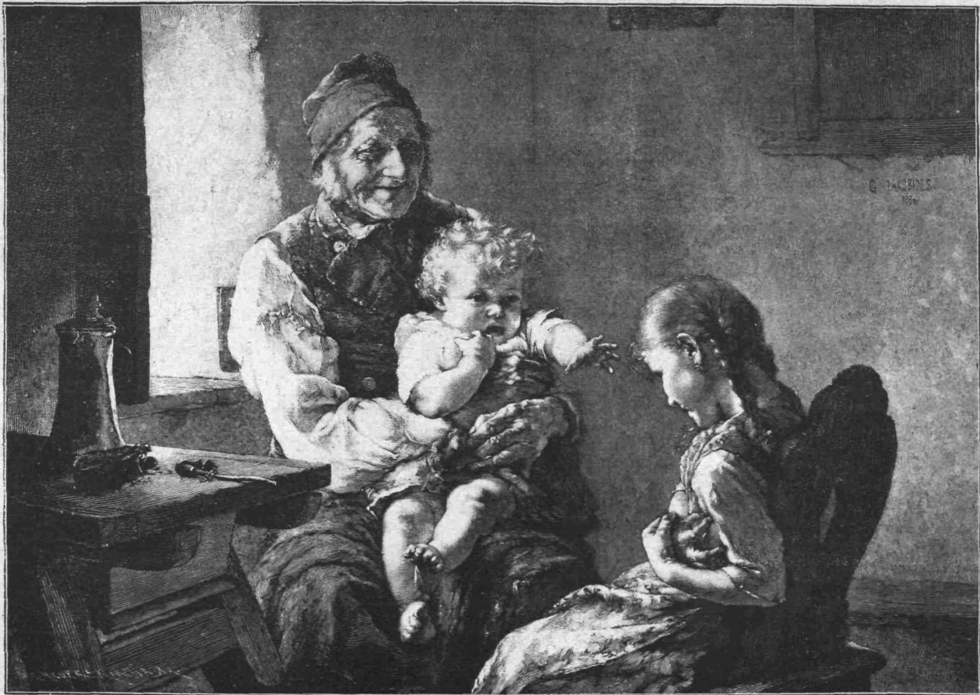
Θ ΔΥΣΤΡΟΠΟΣ — ΕΡΓΟΝ Γ. ΙΑΚΩΒΙΔΟΥ