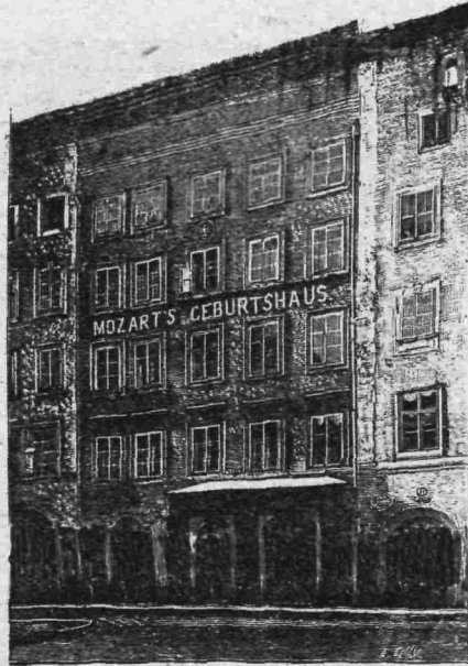
Ἡ οἰκία ἐν ἣ ἐγεννήθη.