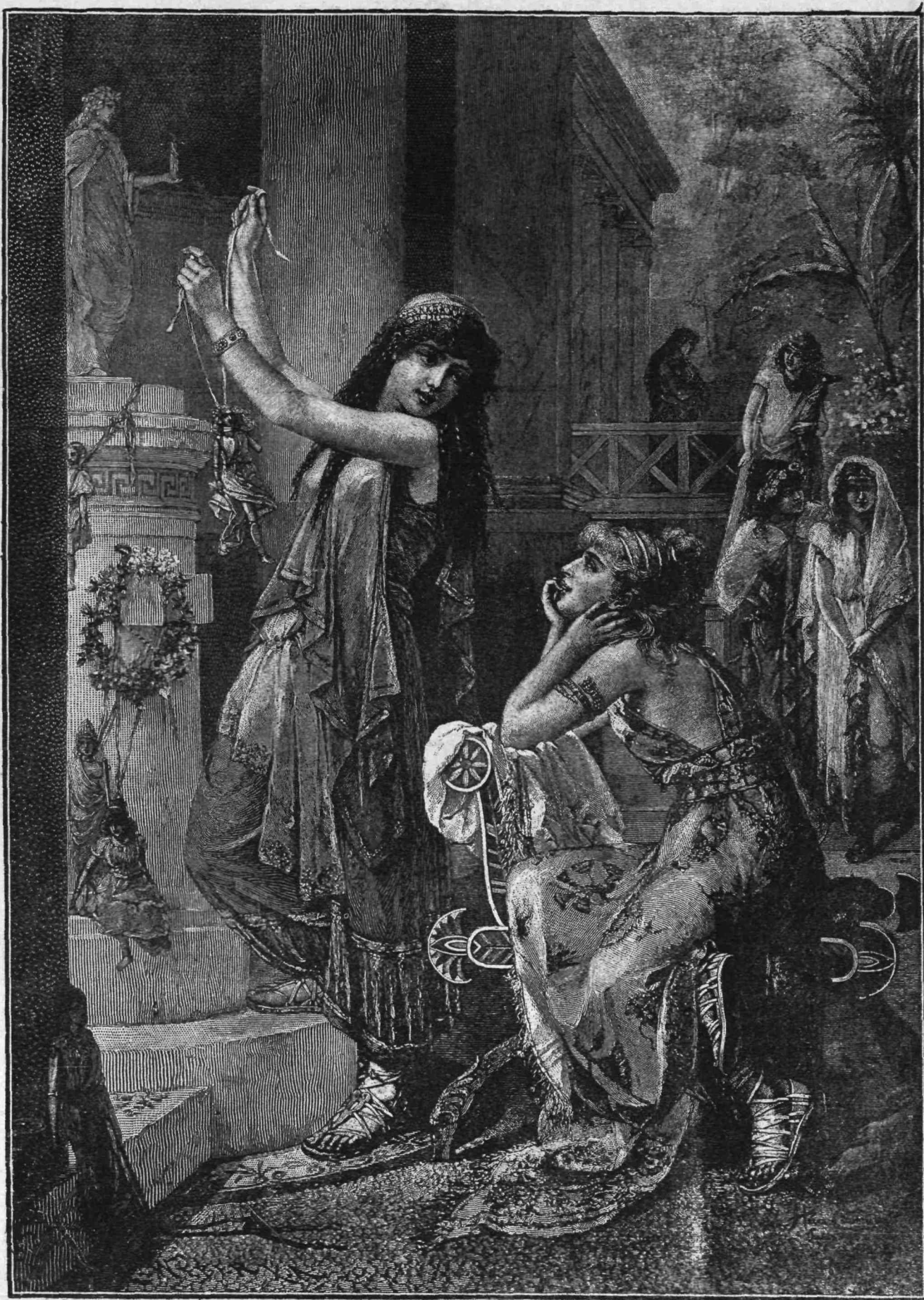
ΚΑΛΛΙΤΕΧΝΙΑ: — ΡΩΜΑΙΩΝ ΠΑΡΘΕΝΩΝ ΑΝΑΘΗΜΑ