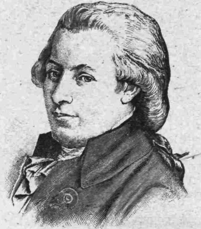
Ὁ Μότσαρτ εἰς ἡλικίαν 35 ἐτῶν.