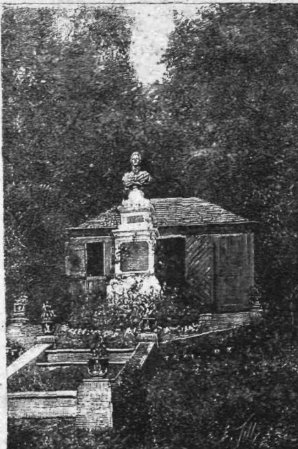
Ἡ οἰκία ἐν ἣ συνέθεσε τὸν «Μαγικὸν ἀὺλόν».