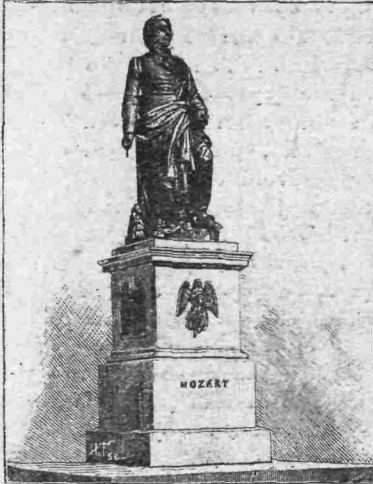
Ὁ ἀνδρῆς τοῦ Μότσαρτ.