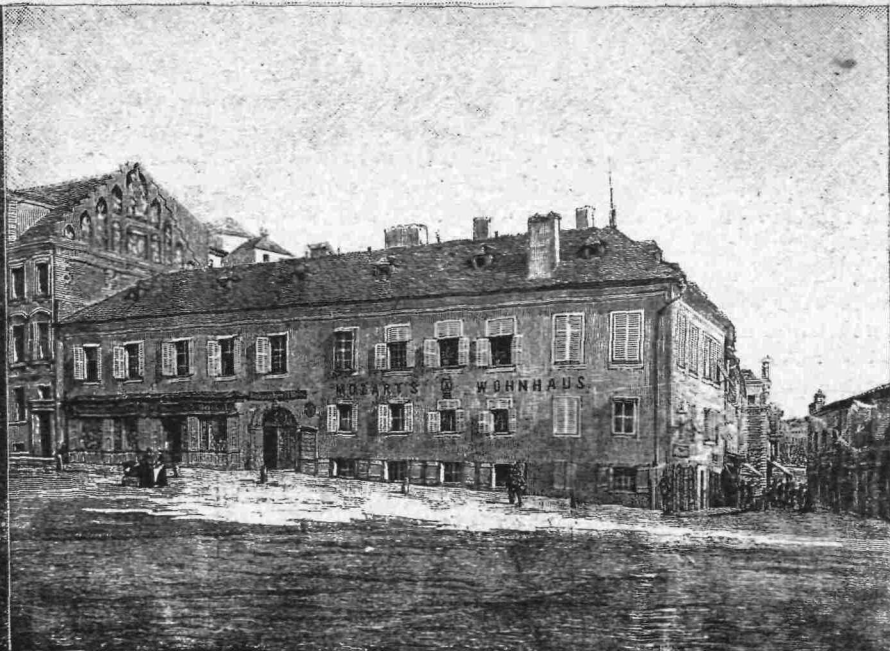
Ἡ οἰκία ἐν ἣ κατοικίδεν ὁ Μότσαρτ τὰ πλεῖστα ἔτη τῆς νεότητός του.

ΕΟΡΤΑΙ ΕΠΙ ΤΗΣ ΕΚΑΤΟΝΤΑΕΤΗΡΙΔΙ ΤΟΥ ΘΑΝΑΤΟΥ ΤΟΥ ΜΟΖΑΡΤ