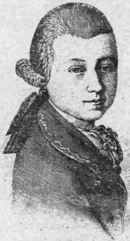
Ὁ Μότσαρτ εἰς ἡλικίαν 14 ἐτῶν.